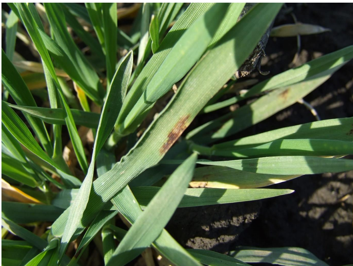
SLIKA 3. SIMPTOM MREŽASTE PEGAVOSTI NA LISTU JEČMA