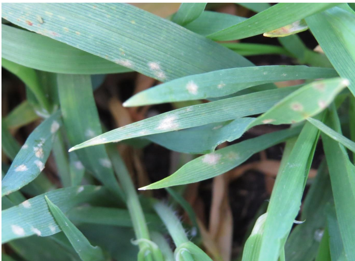
SLIKA 4. SIMPTOMI PEPELNICE NA LISTU JEČMA