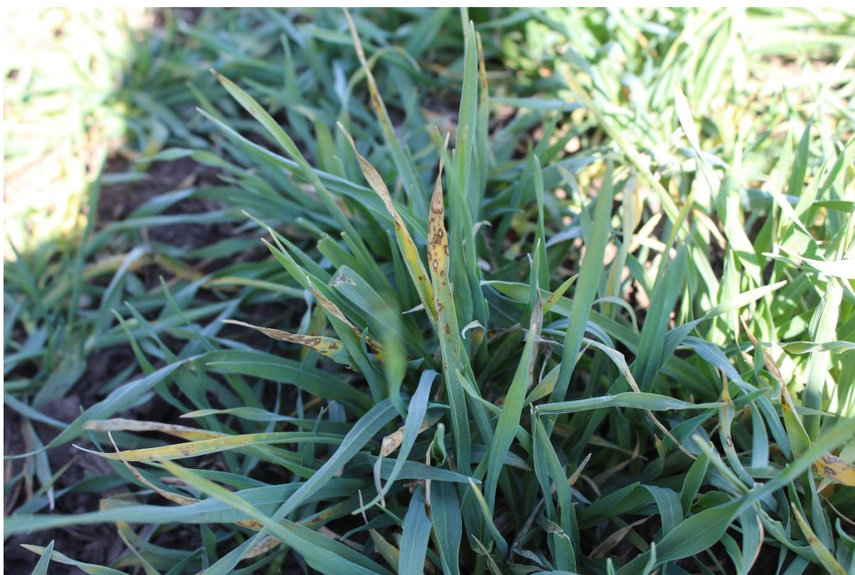
SLIKA 5. SIMPTOMI SOČIVASTE PEGAVOSTI LISTA JEČMA