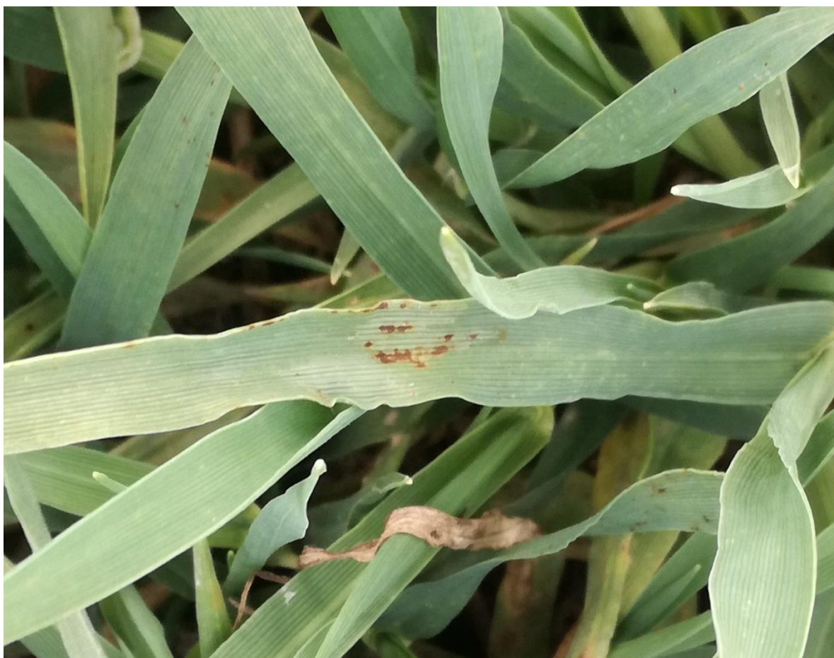
SLIKA 1. SIMPTOM MREŽASTE PEGAVOSTI LISTA JEČMA