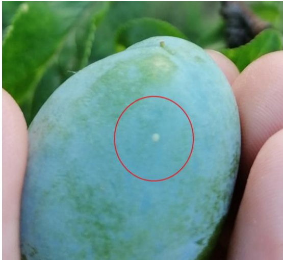
SLIKA 3. JAJE ŠLJIVINOG SMOTAVCA NA PLODU