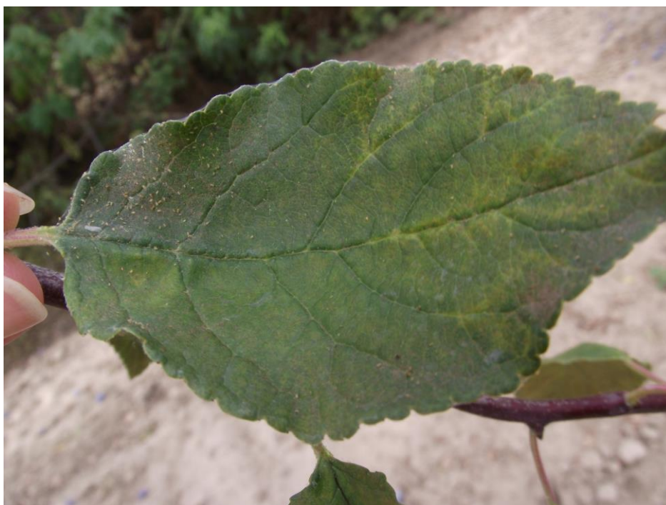
SLIKA 7. SIMPTOM PRISUSTVA GRINJA NA LISTU ŠLJIVE