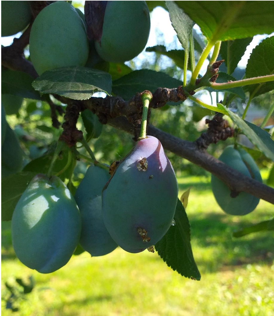
SLIKA 2. ŠTETE NA PLODU OD ŠLJIVINOG SMOTAVCA

NA LISTOVE U BLIZINI PLODOVA. ŠTETE PROUZROKUJU LARVE KOJE SE UBUŠUJU U PLODOVE U KOJIMA SE HRANE MESOM PLODA A PONEKAD I SEMENKOM. NAPADNUTI PLODOVI SE PREPOZNAJU PO SMOLOTOČINI KOJA CURI IZ NJIH I PO TAMNIM HODNICIMA U KOJIMA SE NALAZI GUSENIČNI IZMET. USLED OŠTEĆENJA OD LARVI DOLAZI DO NJIHOVOG PREVREMENOG SAZREVANJA I OPADANJA.