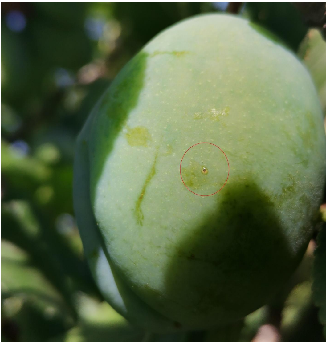
SLIKA 5. JAJE ŠLJIVINOG SMOTAVCA NA PLODU PRED PILJENJE