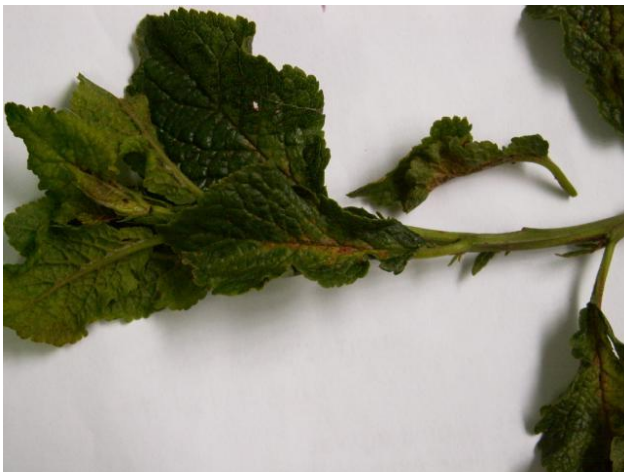
SLIKA 6. SIMPTOM NAPADA GRINJA

TREKUTNI USLOVI U PROIZVODNJI, PRAĆENI VISOKIM TEMPERATURAMA I ODSUSTVOM PADAVINA, POGODUJU RAZVOJU I ŠIRENJU ŠTETOČINA IZ GRUPE GRINJA. ZASADE ŠLJIVA TREBA REDOVNO OBILAZITI I PREGLEDATI NA PRISUSTVO GRINJA. UKOLIKO SE REGISTRUJE NJIHOVO PRISUSTVO, KAKO BI SE SPREČILO NAGLO UMNOŽAVANJE I PODIZANJE POPULACIJE, PREPORUČUJE SE PRIMENA NEKOG OD REGISTROVANIH AKARICIDA UZ OBAVEZNO POŠTOVANJE KARENCE.