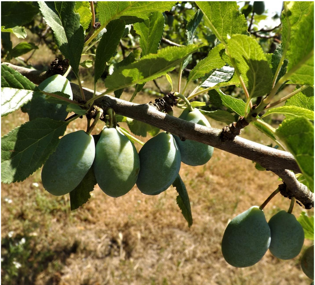
SLIKA 1. FAZA RAZVOJA ŠLJIVE

NA PODRUČJU VOJVODINE ŠLJIVE SE U ZAVISNOSTI OD SORTIMENTA NALAZE U RAZLIČITIM FAZAMA RAZVOJA, OD PLOD DOSTIGAO 70% KRAJNJE VELIČINE DO POČETKA OBOJAVANJA PLODA.