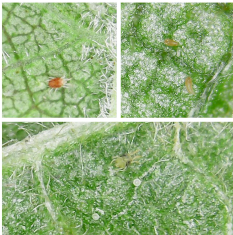
SLIKA 8. RAZLIČITE VRTSE GRINJA NA NALIČJU LISTA ŠLJIVE

..... POŠTOVANI POLJOPRIVREDNI PROIZVOĐAČI I POŠTOVANI GLEDAOCI, DETALJNIJE INFORMACIJE O POJAVI ŠTETNIH ORGANIZAMA I MERAMA KONTROLE MOŽETE POGLEDATI NA SAJTU PROGNOZNO IZVEŠTAJNE SLUŽBE ZAŠTITE BILJA VOJVODINE WWW.PISVOJVODINA.COM