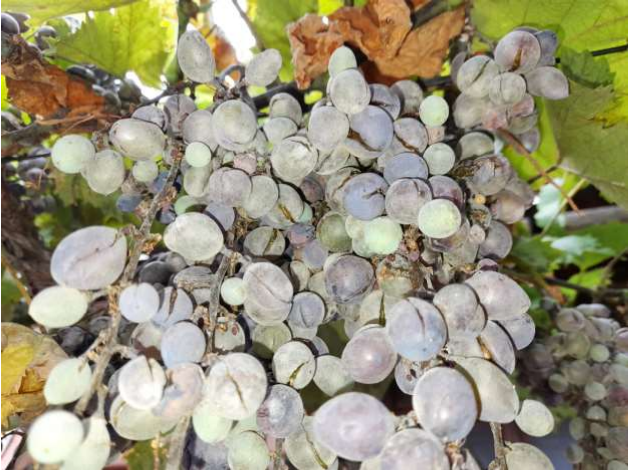
SLIKA 4. SIMPTOM PEPELNICE NA BOBICAMA