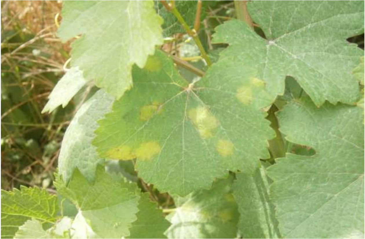
SLIKA 1. SIMPTOM PLAMENJAČE VINOVE LOZE NA LICU LISTA