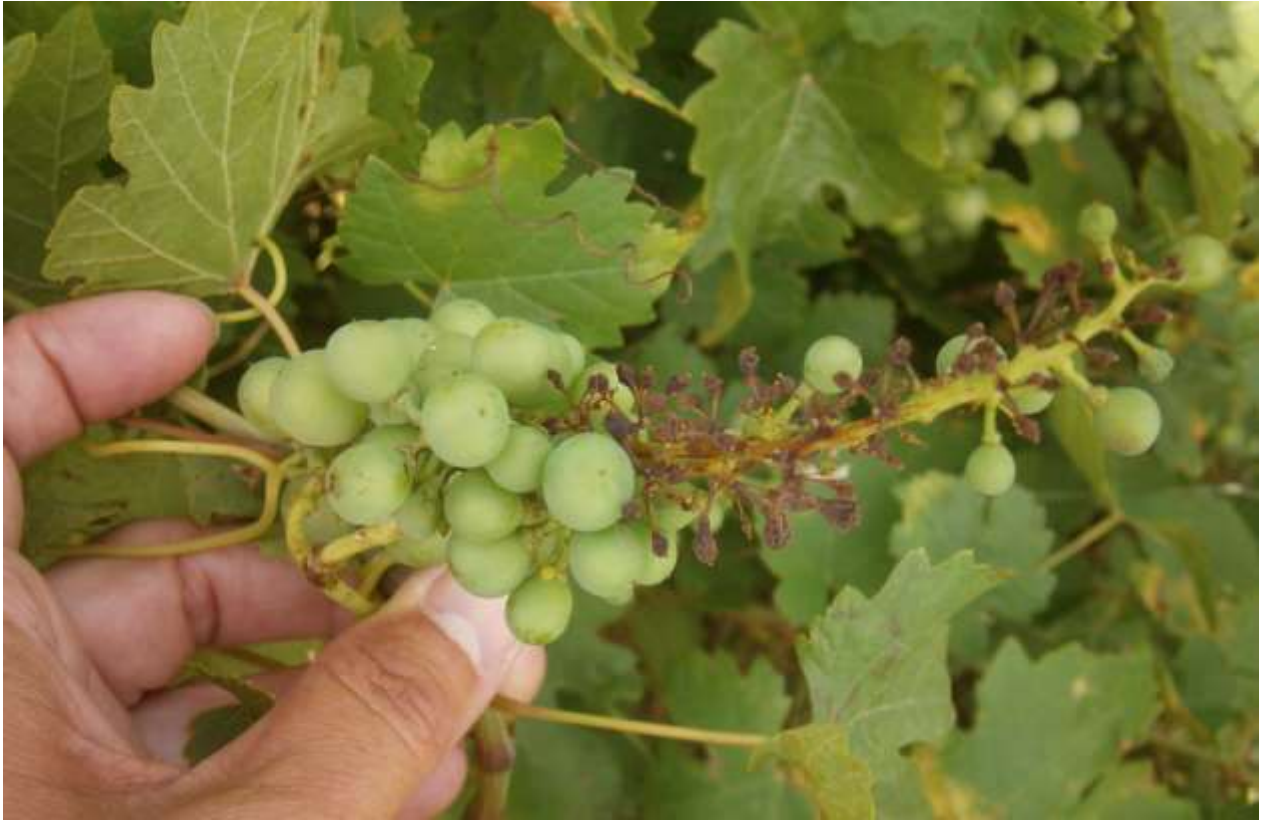
SLIKA 2. SIMPTOM PLAMENJAČE NA GROZDU