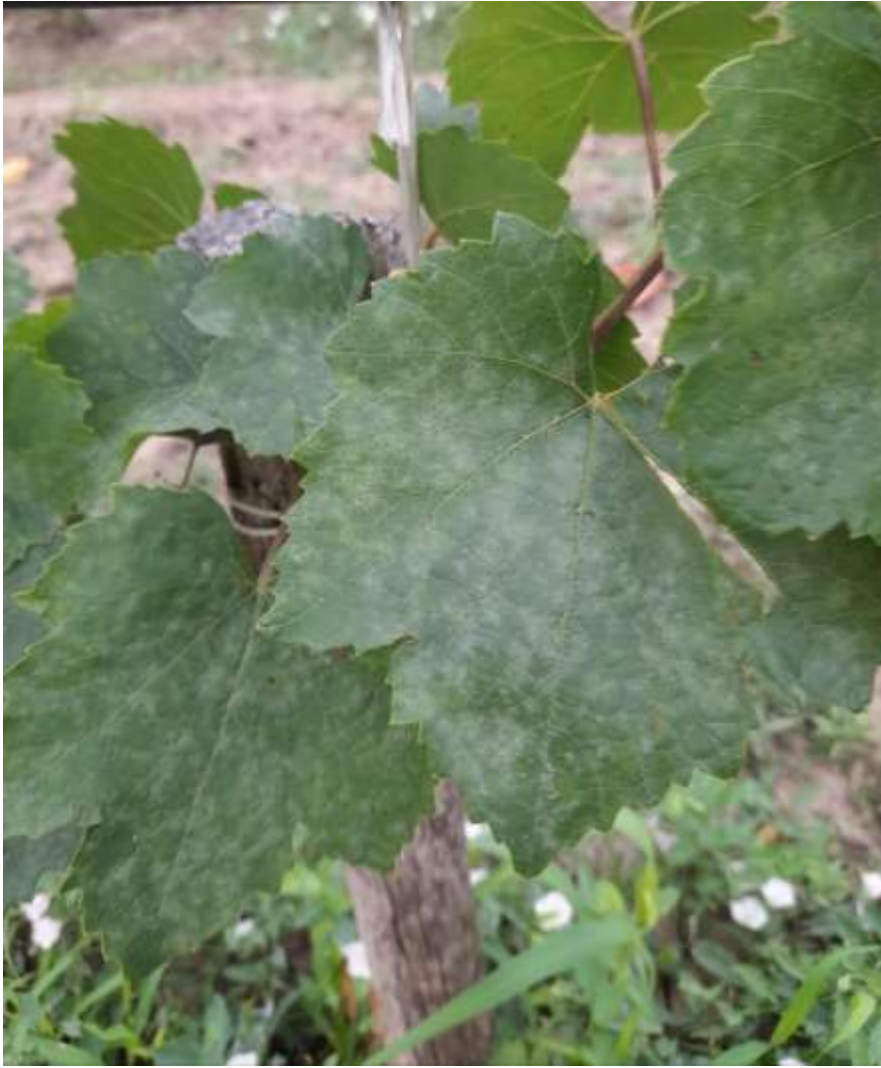
SLIKA 3. SIMPTOM PEPELNICE NA LISTOVIMA