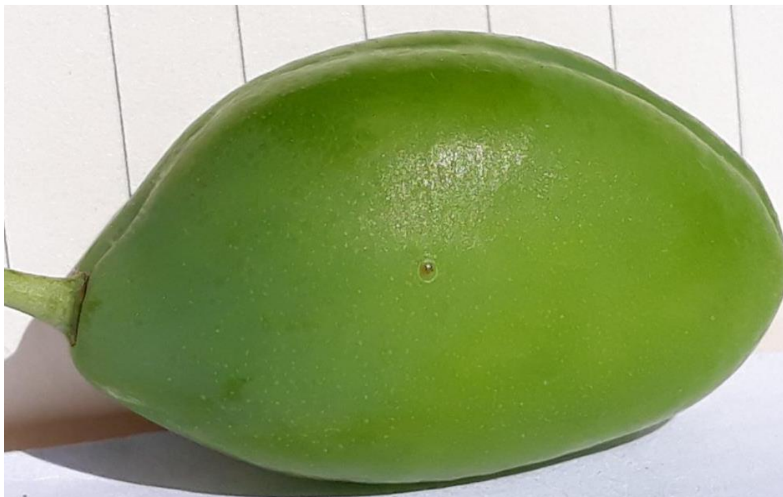
SLIKA 5. JAJE ŠLJIVINOG SMOTAVCA NA PLODU