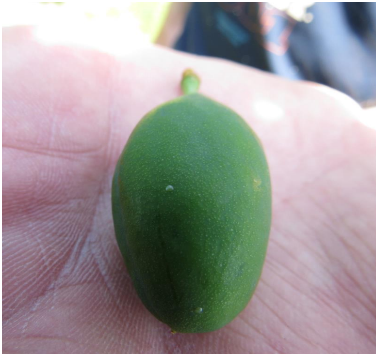
SLIKA 3. JAJA ŠLJIVINOG SMOTAVCA NA PLODU PRED PILJENJE

VIZUELNIM PREGLEDIMA ZASADA ŠLJIVA REGISTROVANO JE PRISUSTVO POLOŽENIH JAJA TE ŠTETOČINE U RAZLIČITIM EMBRIONALNIM FAZAMA RAZVOJA. U TOKU JE PILJENJE LARVI PRVE GENERACIJE ŠLJIVINOG SMOTAVCA.