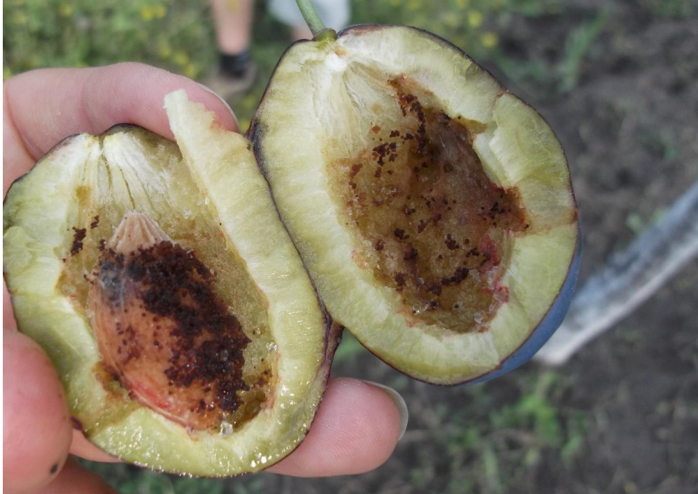
SLIKA 3. IZGLLED UNUTRAŠNOSTI PLODA NAPADNUTOG SA ŠLJIVINIM SMOTAVCEM

VIZUELNIM PREGLEDIMA ZASADA ŠLJIVA REGISTROVANO JE PRISUSTVO POLOŽENIH JAJA TE ŠTETOČINE U RAZLIČITIM EMBRIONALNIM FAZAMA RAZVOJA. U TOKU JE PILJENJE LARVI PRVE GENERACIJE ŠLJIVINOG SMOTAVCA.