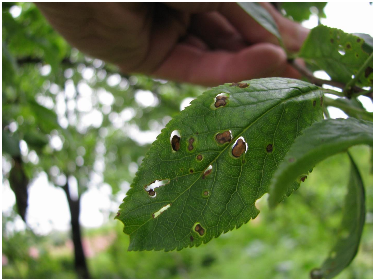
SLIKA 6. SIMPTOMI ŠUPLJIKAVOSTI LISTA NA ŠLJIVI