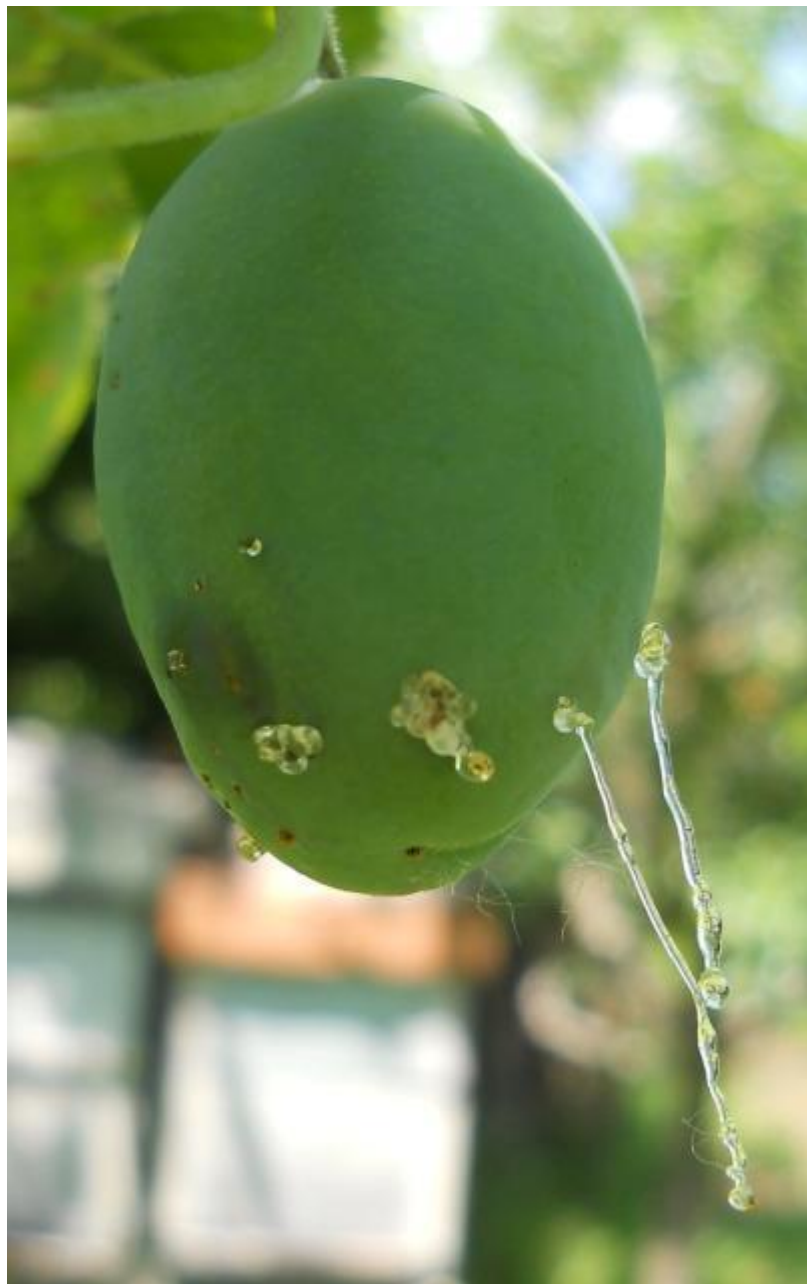
SLIKA 2. CURENJE SMOLE IZ NAPADNUTOG PLODA ŠLJIVE

NALAZI GUSENIČNI IZMET. USLED OŠTEĆENJA OD ISHRANE LARVI DOLAZI DO PREVREMENOG SAZREVANJA I OPADANJA PLODOVA.