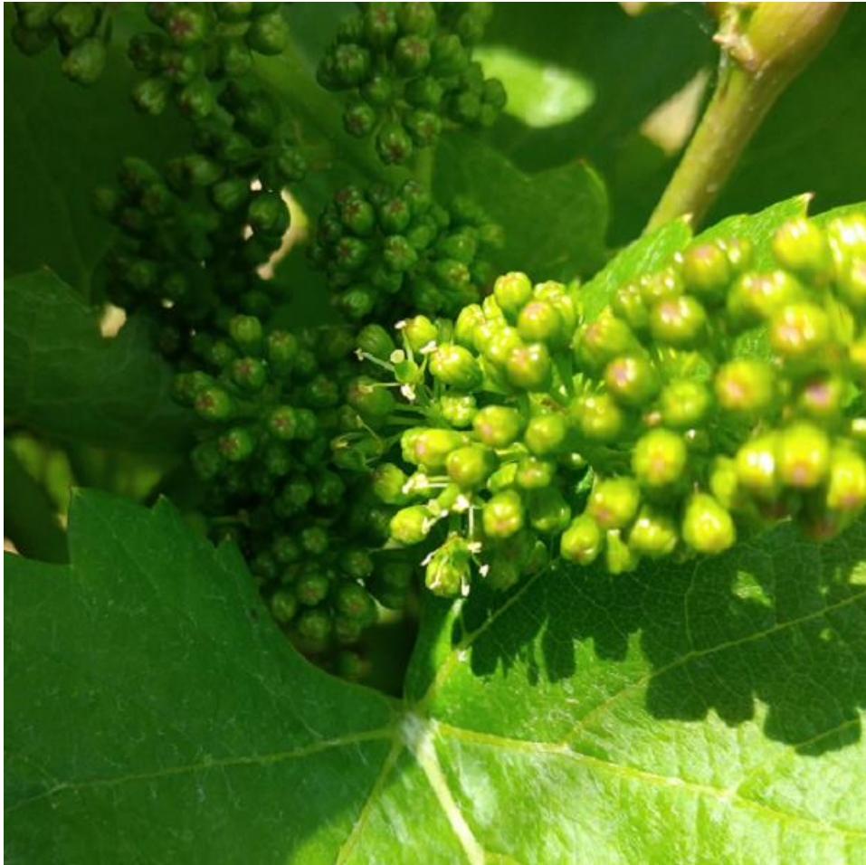
SLIKA 1. FAZA RAZVOJA VINOVE LOZE

FIROPLAZME Flavescence doree (FD) KOJE PROUZROKUJE VEOMA DESTRUKTIVNO OBOLJENJE- ZLATASTO ŽUTILO VINOVE LOZE. S OBZIROM DA SU TEK LARVE TREĆEG RAZVOJNOG STUPNJA SPOSOBNE DA PRENESU FITOPLAZMU HEMIJSKE MERE ZAŠTITE SE TRENUTNO NE PREPORUČUJU. SISTEM PROGNOZNO-IZVEŠTAJNE SLUŽBE ZAŠTITE BILJA VOJVODINE PRATI BIOLOGIJU I RAZVOJ TE ŠTETOČINE I NA VREME ĆE SIGNALIZIRATI VREME ZA PRIMENU INSEKTICIDA.