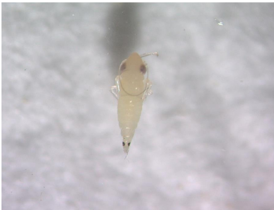
SLIKA 7. LARVA CIKADE Scaphoideus titanus

..... POŠTOVANI POLJOPRIVREDNI PROIZVOĐAČI I POŠTOVANI GLEDAOCI, DETALJNIJE INFORMACIJE O POJAVI ŠTETNIH ORGANIZAMA I MERAMA KONTROLE MOŽETE POGLEDATI NA SAJTU PROGNOZNO IZVEŠTAJNE SLUŽBE ZAŠTITE BILJA VOJVODINE WWW.PISVOJVODINA.COM