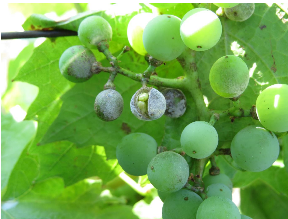
SLIKA 5. OŠTEĆENJA NA GROZDU OD PEPELNICE VINOVE LOZE