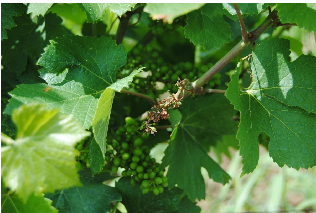
SLIKA 3. OŠTEĆENJA NA GROZDU OD PLAMENJAČE VINOVE LOZE