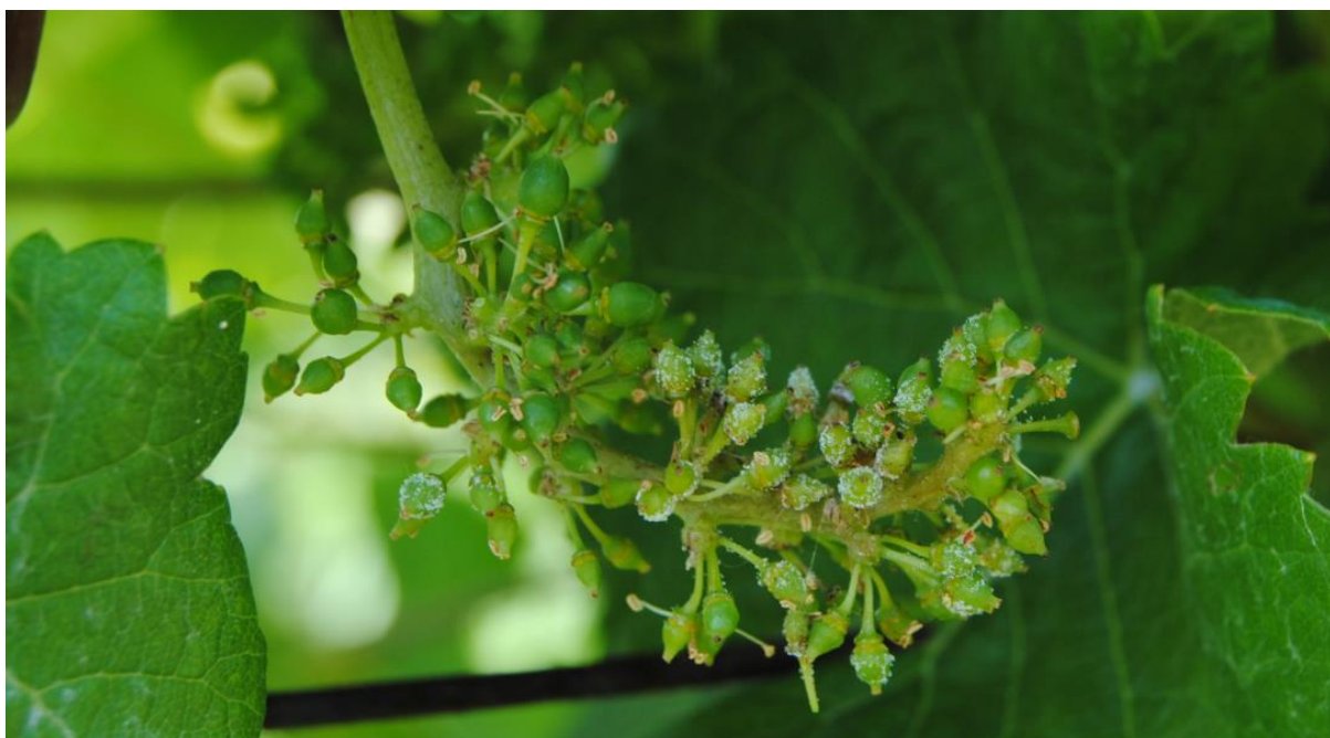
SLIKA 2. SIMPTOM PLAMENJAČE VINOVE LOZE NA GROZDU