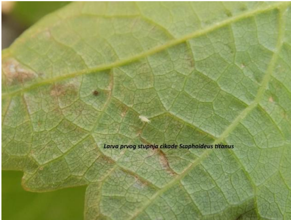
SLIKA 6. LARVA Scaphoideus titanus PRAVOG LARVENOG STUPNJA RAZVOJA