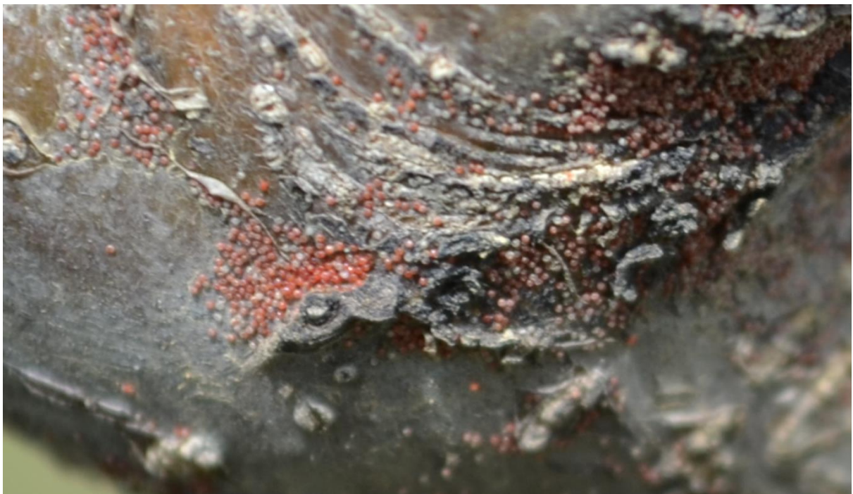
SLIKA 7. JAJA CRVENOG VOĆNOG PAUKA