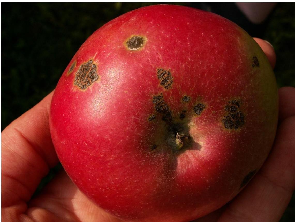
SLIKA 4. SIMPTOM KRSTAVOSTI NA PLODU JABUKE