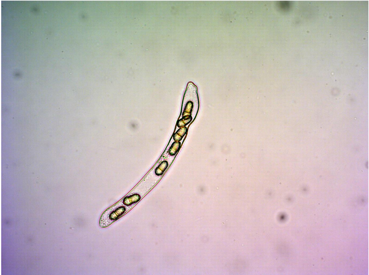
SLIKA 6. ZRELE ASKOSPORE U ASKUSU