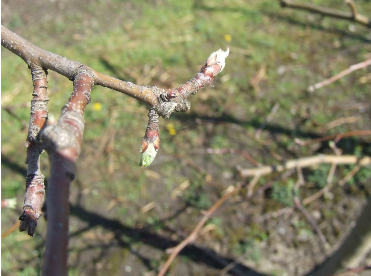
SLIKA 1. FAZA RAZVOJA JABUKE

U ZASADIMA GDE JE PROŠLE GODINE ZABELEŽEN JAK NAPAD LISNIH VAŠI, ŠTITASTIH VAŠI ILI GRINJA, PREPORUČUJE SE I PRIMENA PREPARATA NA BAZI MINERALNOG ULJA (GALMIN) U KONCETRACIJI 3%.