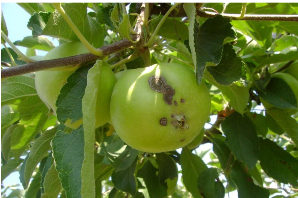
SLIKA 3. SIMPTOM KRASTAVOSTI NA PLODU JABUKE