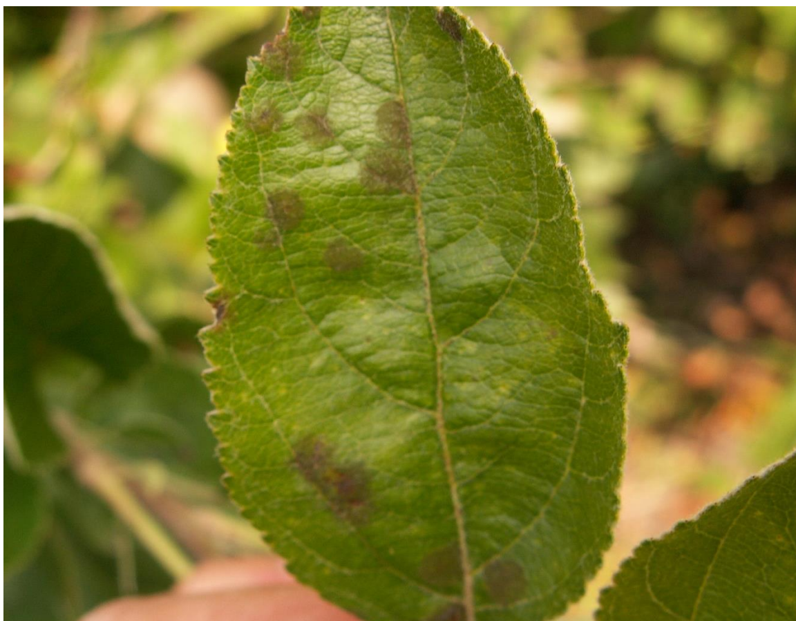
SLIKA 2. SIMPTOM ČĎAVE PEGAVOSTI NA LISTU JABUKE