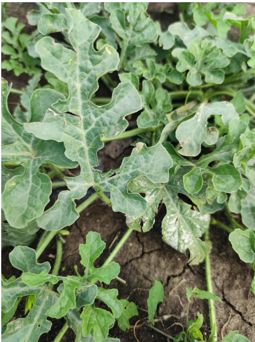
SLIKA 3. SIMPTOM LUBENICE