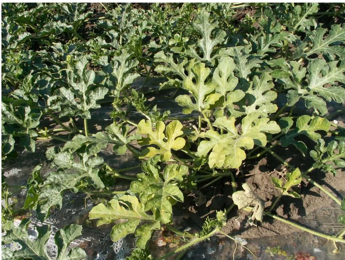
SLIKA 4. SIMPTOM NAPADA GRINJA