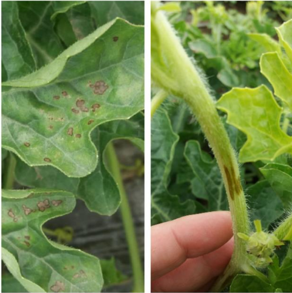
SLIKA 1. ANTRAKNOZA NA LISTU I VREŽI LUBENICE