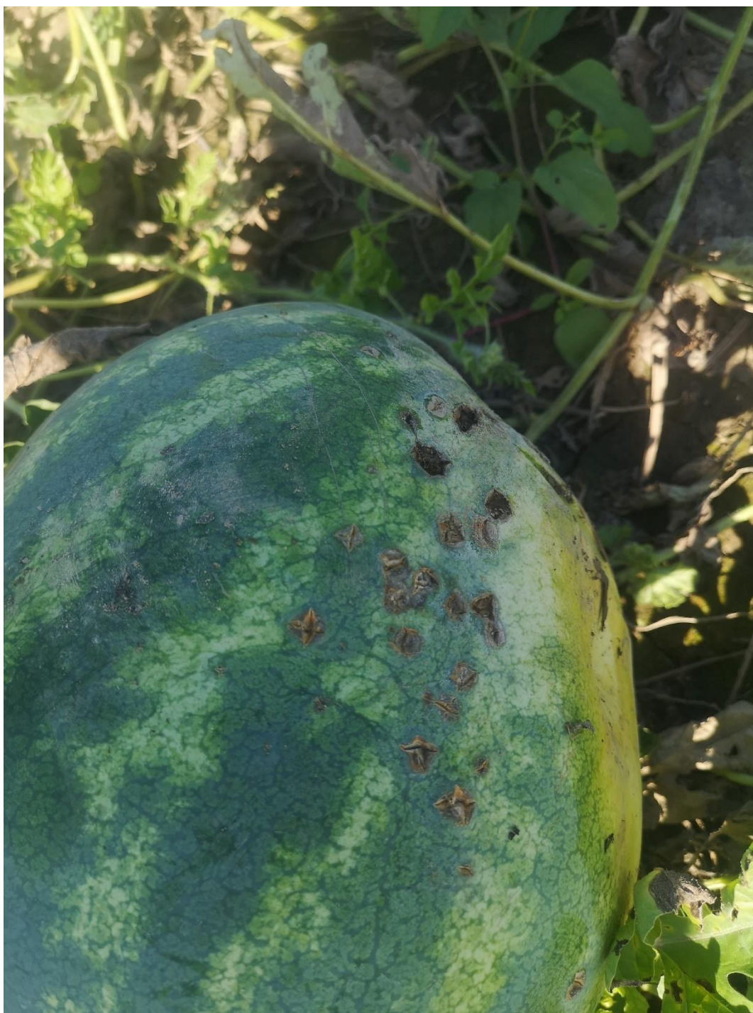
SLIKA 2. SIMPTOM ANTRAKNOZE NA PLODU