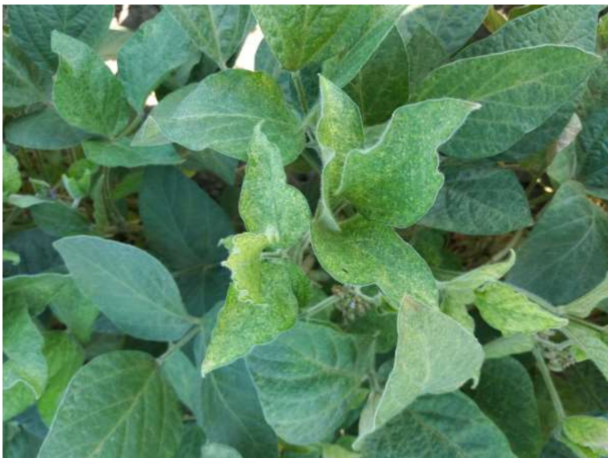
SLIKA 3. SIMPTOM OŠTEĆENJA NA LISTOVIMA SOJE OD GRINJA