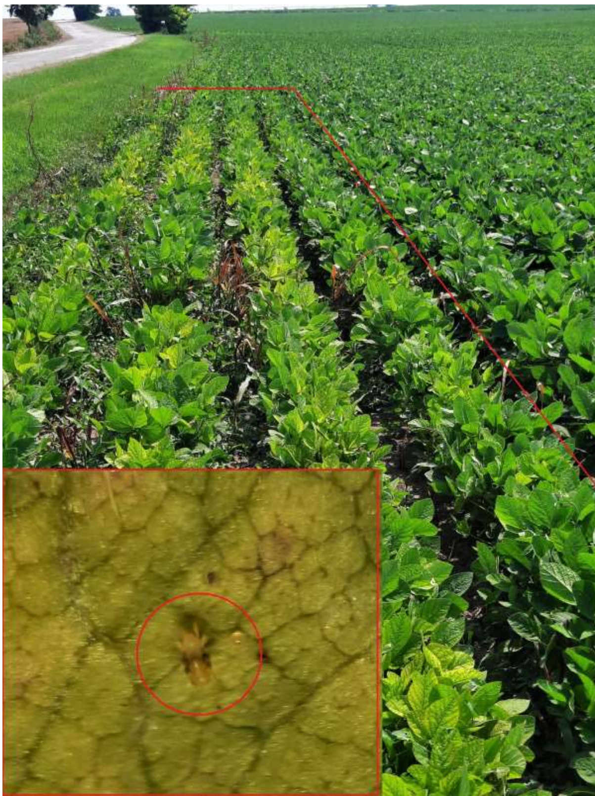
SLIKA 2. USEV NAPADNUT GRINJAMA I OBIČNI PAUČINAR NA NALIČJU LISTA