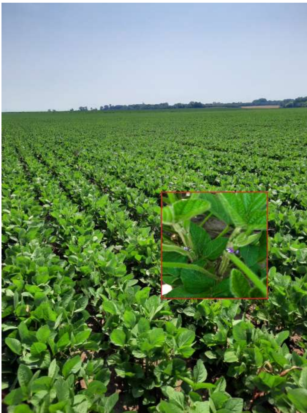
SLIKA 1. FAZA RAZVOJA SOJE