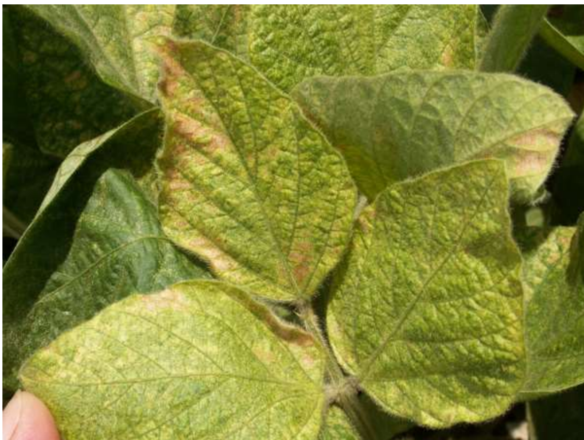
SLIKA 4. SIMPTOM OŠTEĆENJA NA LISTOVIMA SOJE OD GRINJA