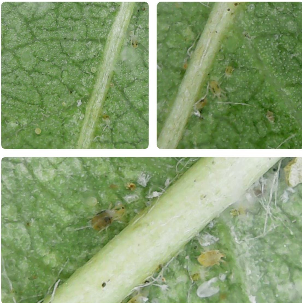
SLIKA 1. OBIČNI PAUČINAR NA NALIČJU LISTA

OBIČNI PAUČINAR JE JEDNA OD NAJŠTETNIJIH GRINJA U NAŠIM USLOVIMA. HRANI SE KAKO NA GAJENIM TAKO I NA KOROVSKIM BILJKAMA. OD POLJOPRIVREDNIH USEVA REDOVNO SE SREĆE NA PARADAJZU, PAPIRICI, KRASTAVCIMA, LUBENICAMA, TIKVICAMA, SOJI, KUKURUZU, JABUKAMA, BRESKVAMA I MNOGIM DRUGIM GAJENIM KULTURAMA.