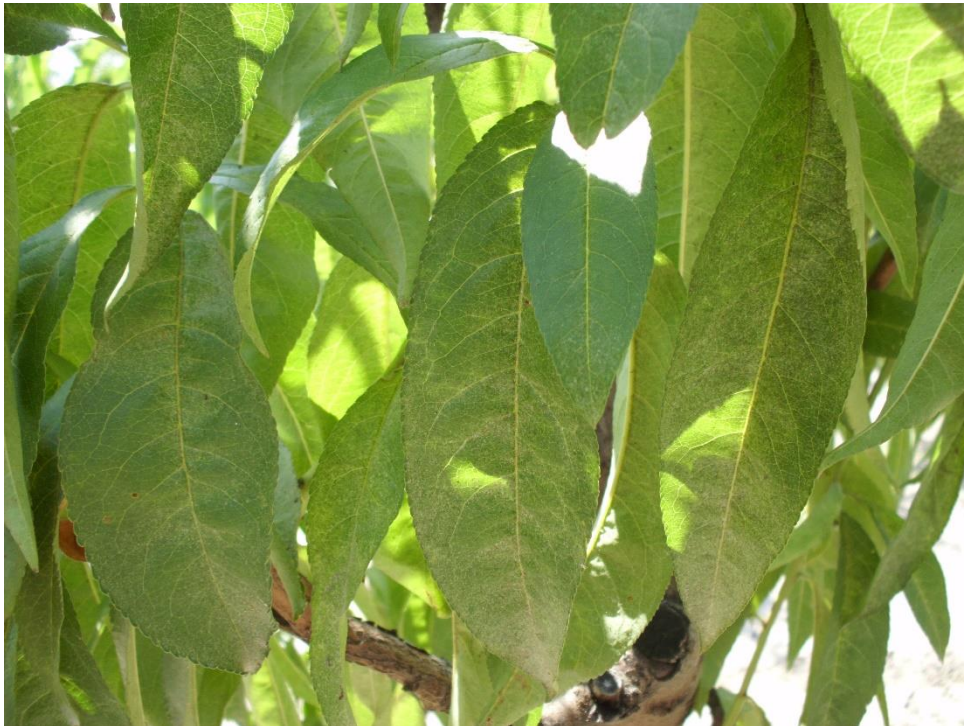
SLIKA 2. SIMPTOM NAPADA OBIČNOG PAUČINARA NA BRESKVI

OVE ŠTETOČINE ŽIVE NA NALIČJU LISTA GDE SE HRANE SISAJUĆI SOKOVE BILJAKA. PRVI SIMPTOMI NAPADA SE UOČAVAJU NA LICU LISTA U OBLIKU SITNIH PEGA SREBRNASTOBELE BOJE. KAKO SE BROJNOST GRINJA I NAPAD UVEĆAVA, PEGE SE MEĐUSOBNO SPAJAJU I ČITAVA POVRŠINA LISTA ŽUTI I SUŠI SE. KOD NAPADNUTIH BILJAKA POVEĆAVA SE TRANSPIRACIJA, SMANJUJE INTENZITET FOTOSINTEZE ŠTO ZA POSLEDICU IMA SKARAĆENJE VEGETACIJE, ZAOSTAJANJE U PORASTU I FORMIRANJE MANJIH I SITNIJIH PLODOVA.