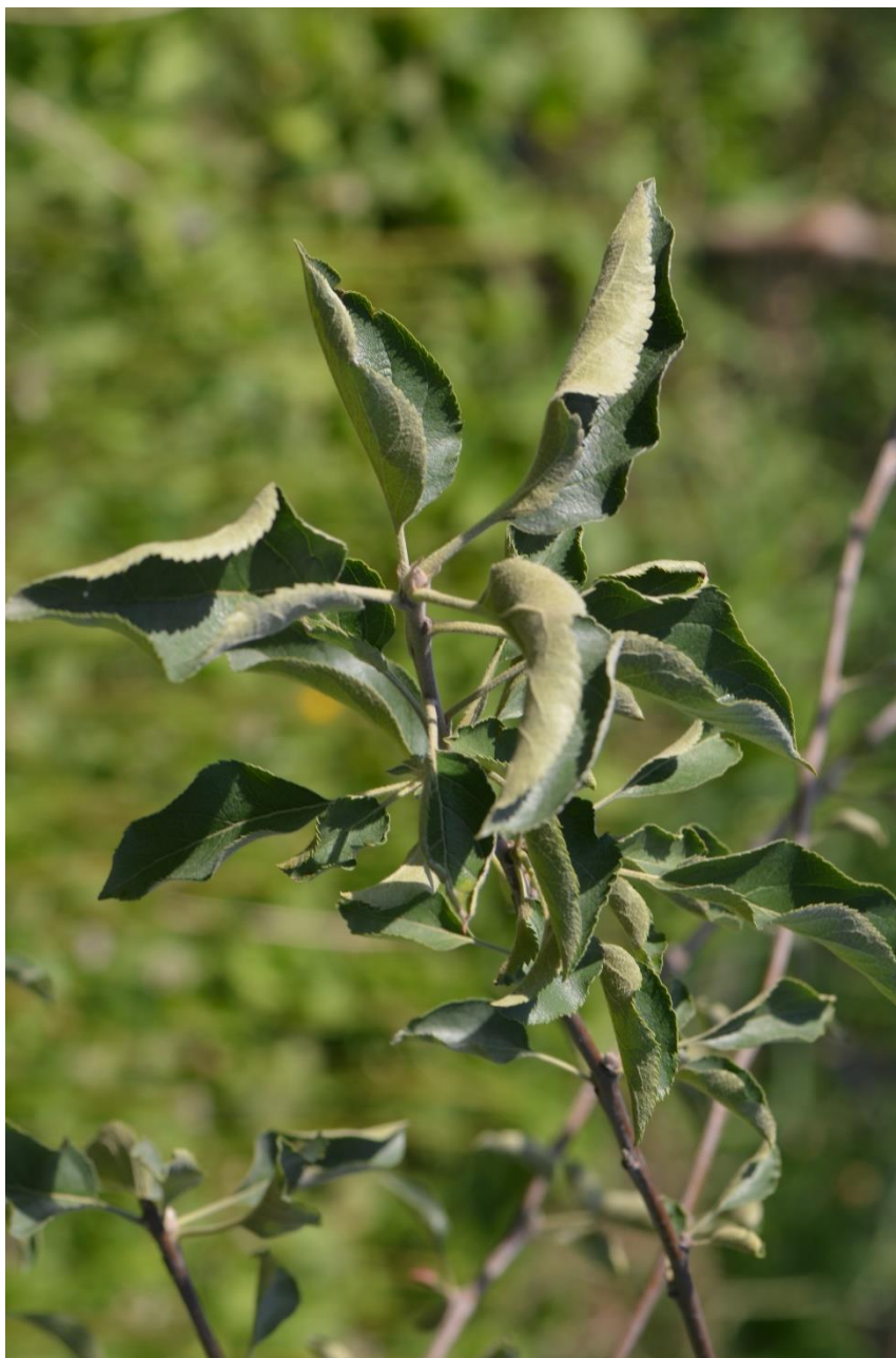
SLIKA 9. SIMPTOM NAPADA RĐASTE GRINJE NA JABUCI

PRILIKOM PRIMENE HEMIJSKIH MERA ZAŠTITE, OBAVEZNO TREBA PROČITATI UPUTSTVO O KORIŠĆENJU PESTICIDA I PRIDRŽAVATI SE PROPISANIH KARENCI. PREPORUKA JE DA SE TRETMAN SPROVEDE U VEČERNJIM ČASOVIMA ZBOG VISOKIH DNEVNIH TEMPERATURA VAZDUHA.