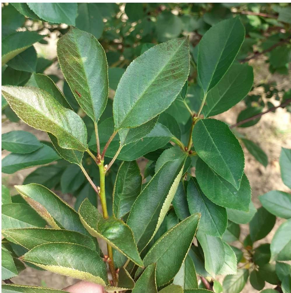
SLIKA 8. SIMPTOM NAPADA RĐASTE GRINJE NA VIŠNJI