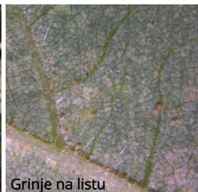
SLIKA 3. SIMPTOM NAPADA OBIČNOG PAUČINARA NA SOJI