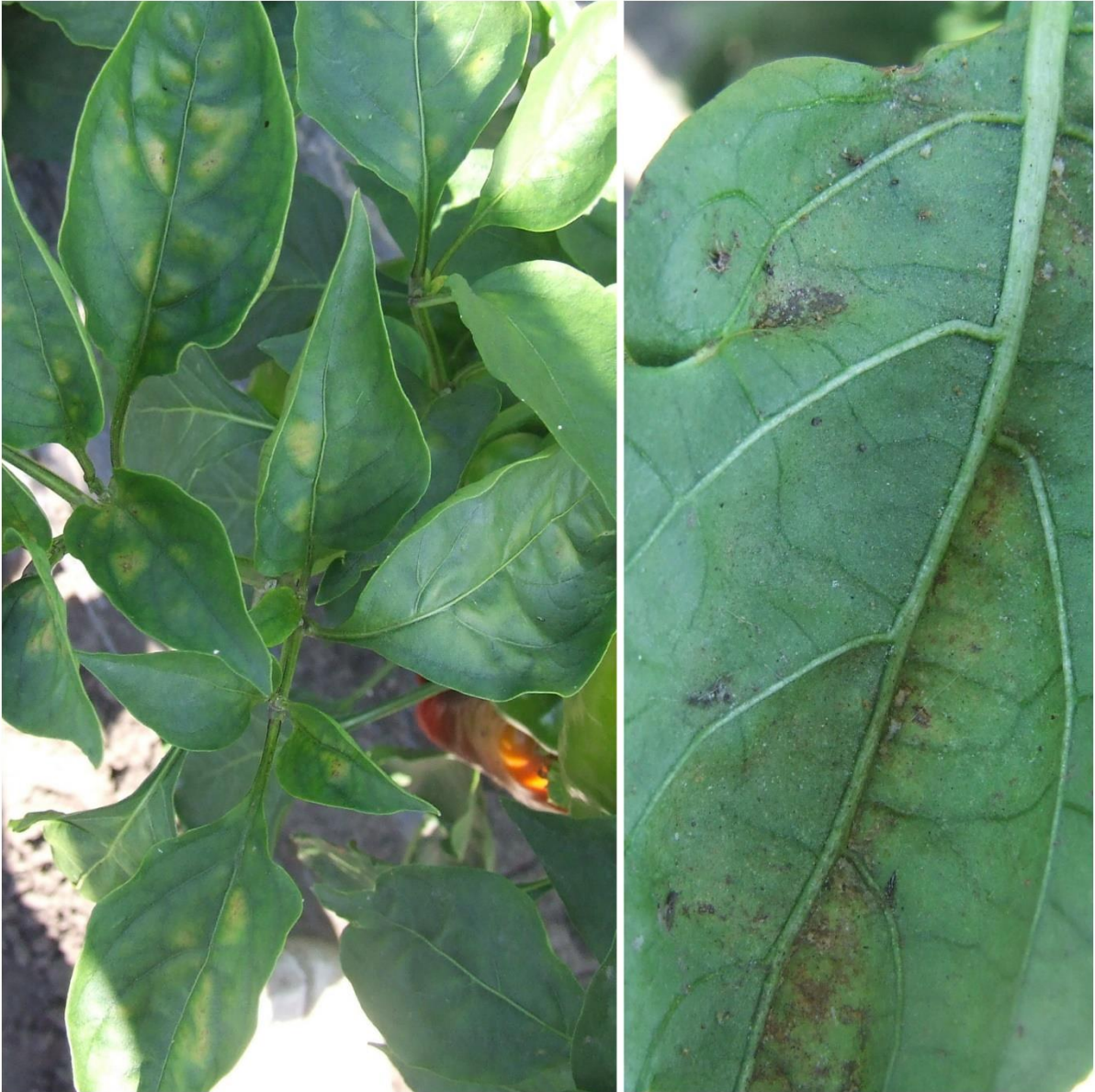
SLIKA 5. SIMPTOM NAPADA OBIČNOG PAUČINARA NA PAPRICI