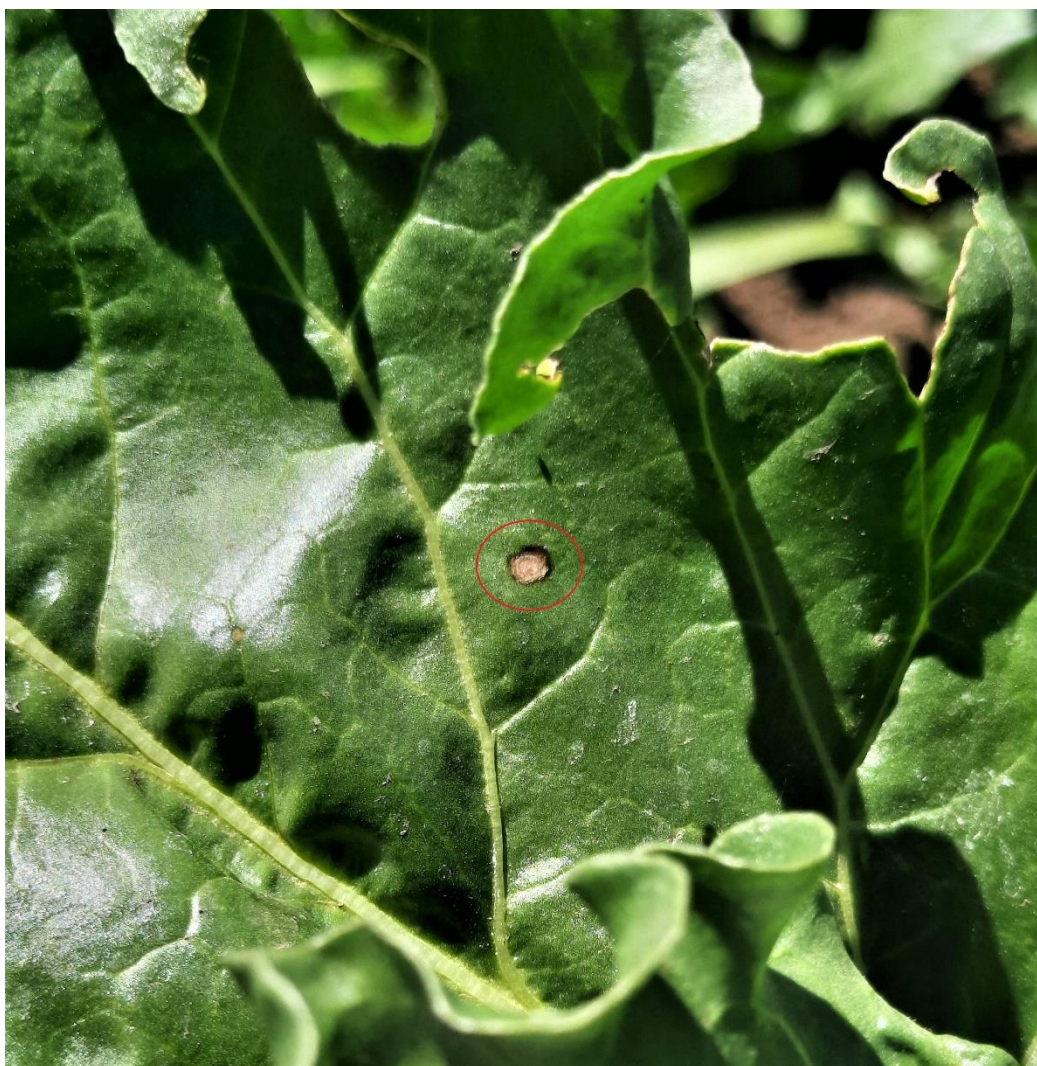
SLIKA 2. SIMPTOM PEGAVOSTI LIŠĆA REPE