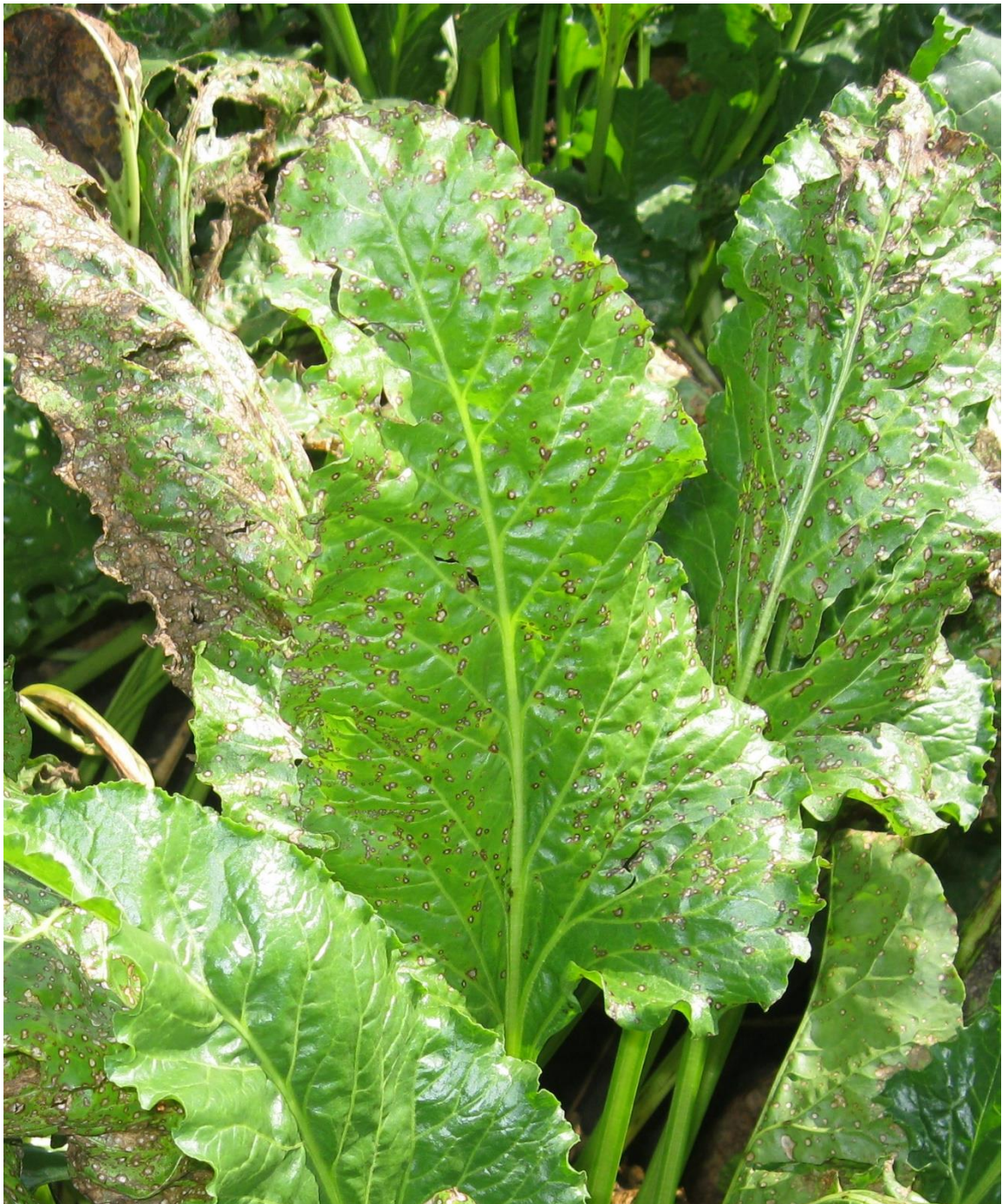
SLIKA 8. SIMPTOM PEGAVOSTI LIŠĆA REPE

..... POŠTOVANI POLJOPRIVREDNI PROIZVOĐAČI I POŠTOVANI GLEDAOCI, DETALJNIJE INFORMACIJE O POJAVI ŠTETNIH ORGANIZAMA I MERAMA KONTROLE MOŽETE POGLEDATI NA SAJTU PROGNOZNO IZVEŠTAJNE SLUŽBE ZAŠTITE BILJA VOJVODINE WWW.PISVOJVODINA.COM