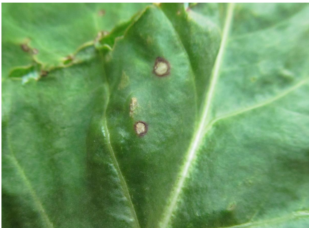
SLIKA 3. SIMPTOM PEGAVOSTI LIŠĆA REPE