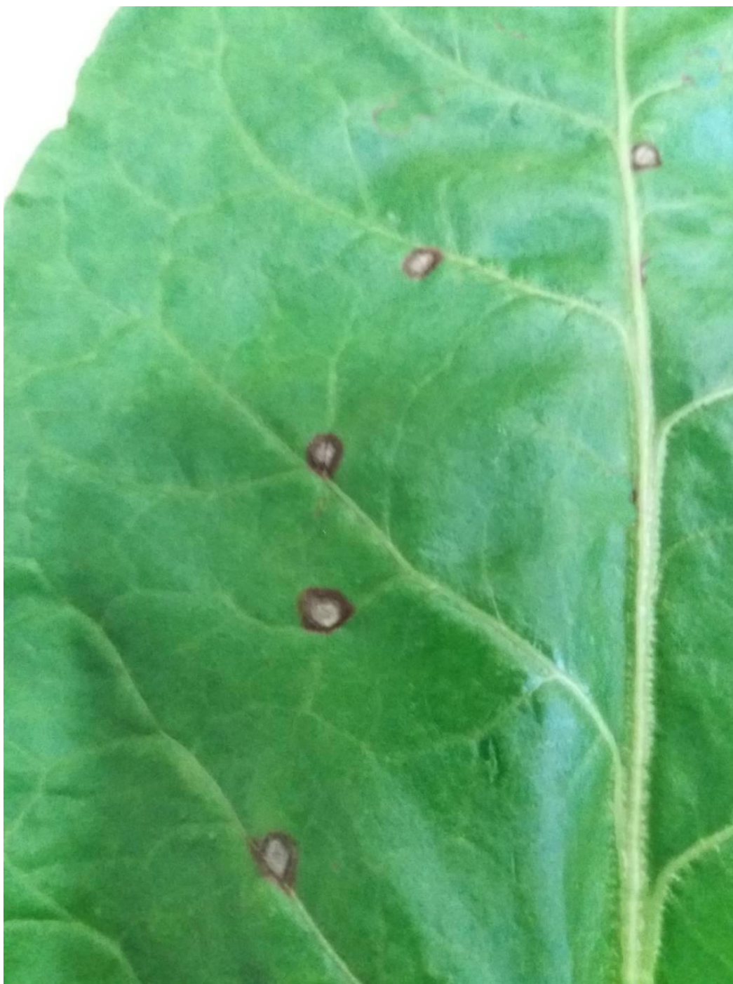
SLIKA 5. SIMPTOM PEGAVOSTI LIŠĆA REPE