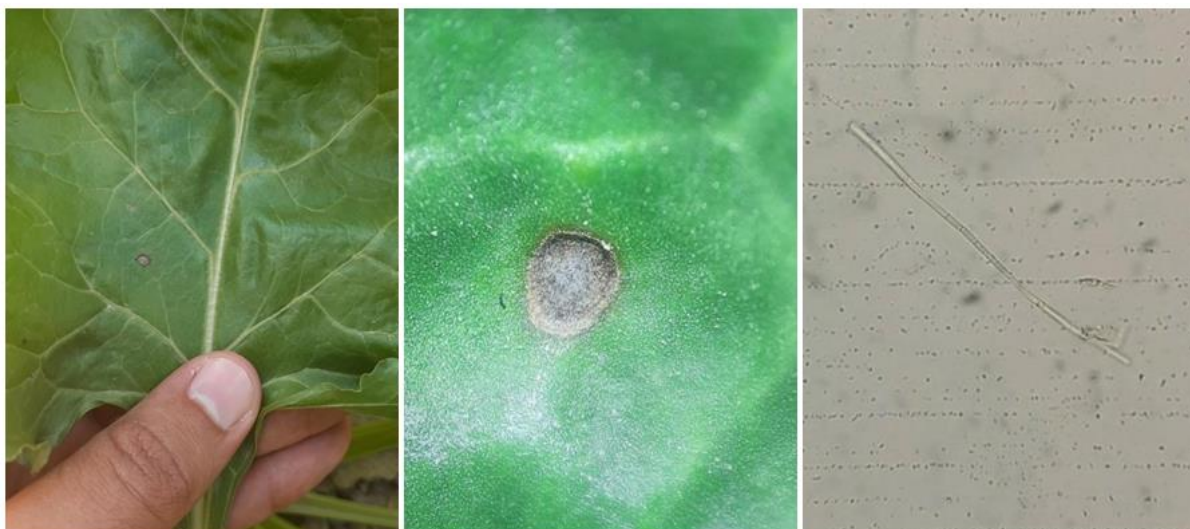
SLIKA 4. SIMPTOM PEGAVOSTI LIŠĆA REPE I KONIDIJA Cercospora beticola