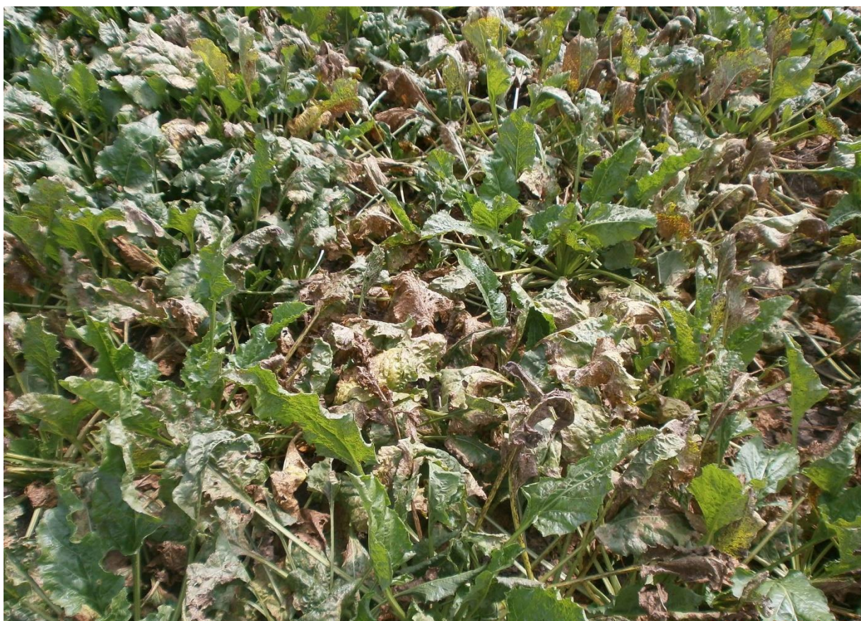
SLIKA 6. SIMPTOM PEGAVOSTI LIŠČA REPE