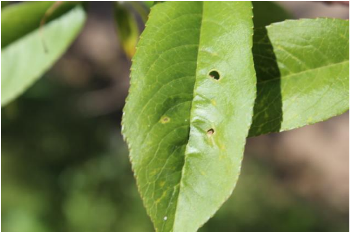
SLIKA 4. SIMPTOM ŠUPLJIKAVOSTI NA LISTU BRESKVE