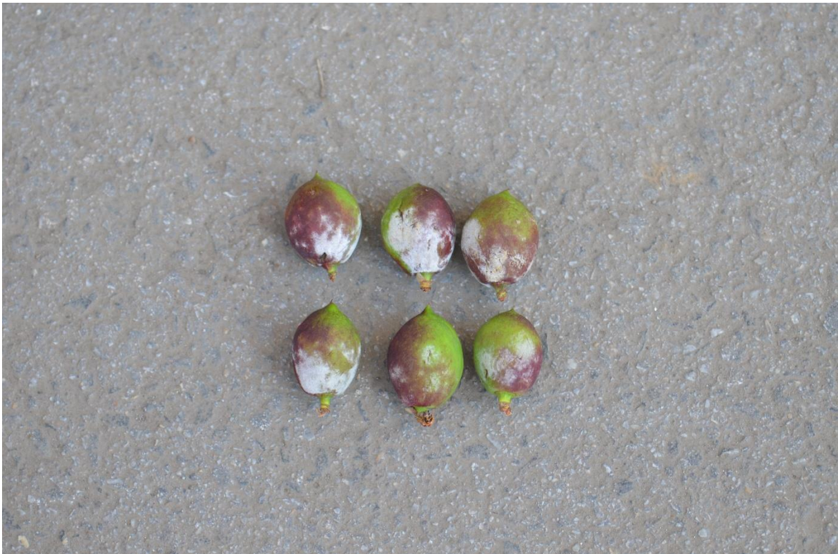
SLIKA 2. SIMPTOMI PEPELNICE NA PLODOVIMA NEKTARINE

GLJIVA KOJA PROUZROKUJE PEPELNICU NAPADA SVE ZELJASTE DELOVE BRESKVE I NEKTARINE: LIŠĆE, MLADARE, CVETOVE I PLODOVE. NA ZARAŽENIM DELOVIMA JAVLJA SE PEPELJASTO BELA MICELIJSKA PREVLAKA KOJU ČINE REPRODUKTIVNI ORGANI GLJIVE. PEPELNICA SE NAJČEŠĆE JAVLJA NA MLADOM LIŠĆU KOJE SE U POČETKU UVIJA, A PRI JAČOJ ZARAZI SE SUŠI I OPADA. PLODOVI SU NAJOSETLJIVIJI U POČETNIM FAZAMA RAZVOJA, OD ZAMETANJA DO FAZE VELIČINE ORAHA. ZARAZA KOD TAKVIH MLADIH PLODOVA DOVODI DO SUŠENJA I NJIHOVOG OPADANJA. KASNIJE ZARAZE SE ISPOLJAVAJU U VIDU BELIČASTIH ILI SIVKASTIH PEGA NA PLODOVIMA.