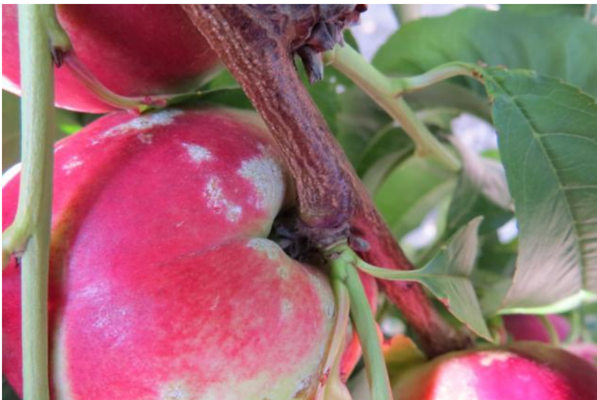
SLIKA 3. SIMPTOM PEPELNICE NA PLODU NEKTARINE