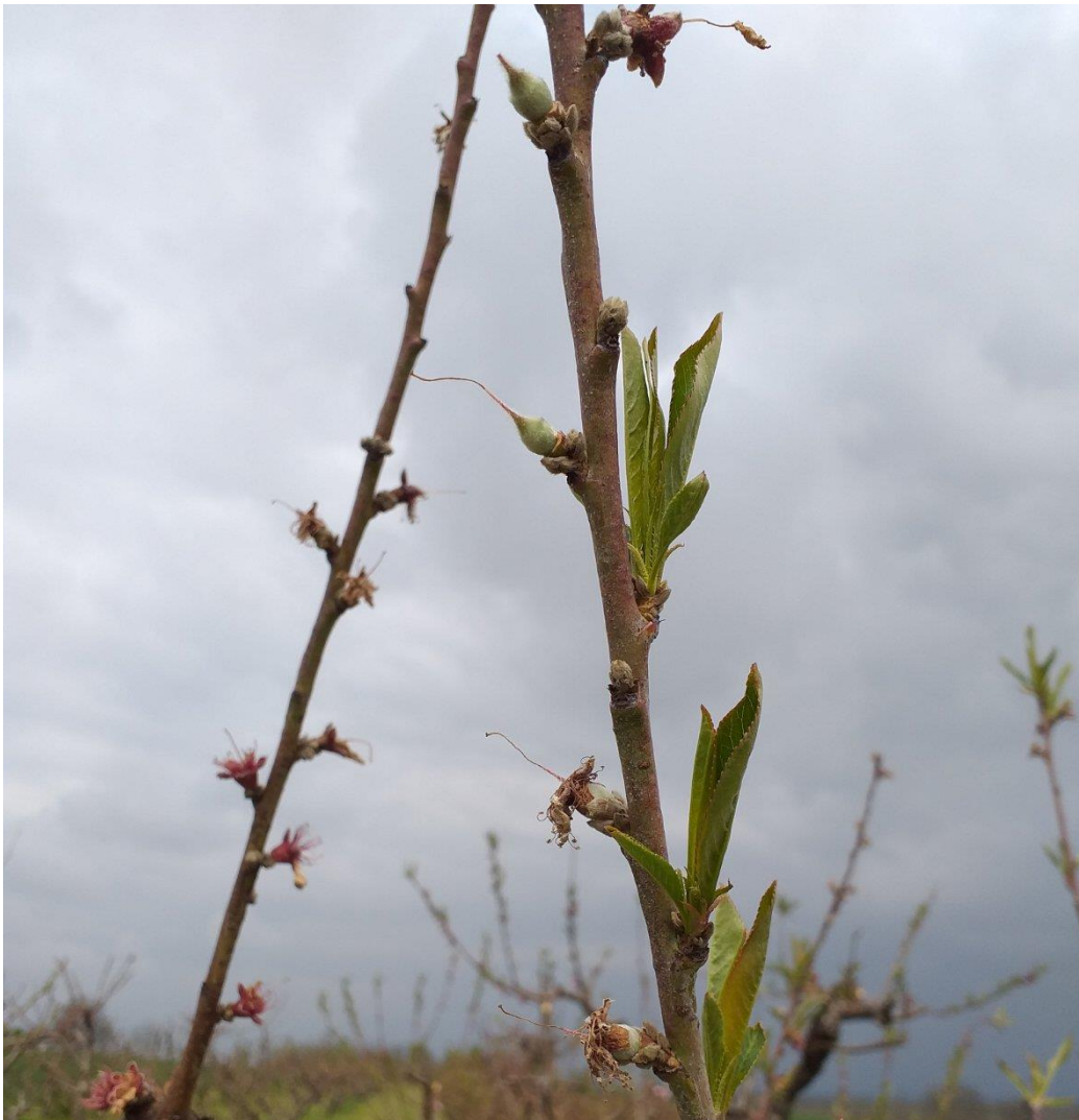
SLIKA 1. FAZA RAZVOJA NEKTARINE

NA PODRUČJU VOJVODINE ZASADI BRESAKA I NEKTARINA SE NALAZE U FAZI OD KRAJA CVETANJA DO ZELENI PLODNIK OKRUŽEN SA SASUŠENOM CVETNOM LOŽOM.