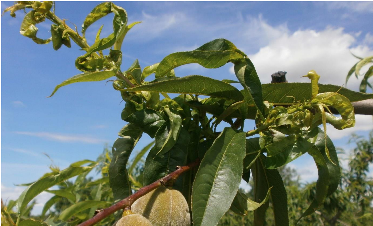
SLIKA 7. SIMPTOM NAPADA ZELENE BRESKVINE VAŠI

POŠTOVANI POLJOPRIVREDNI PROIZVOĐAČI I DRAGI GLEDAOCI, DETALJNIJE INFORMACIJE O POJAVI ŠTETNIH ORGANIZAMA I MERAMA KONTROLE MOŽETE POGLEDATI NA SAJTU PROGNOZNO IZVEŠTAJNE SLUŽBE ZAŠTITE BILJA VOJVODINE WWW.PISVOJVODINA.COM