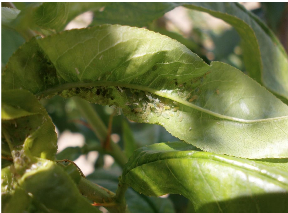
SLIKA 6. ZELENA BRESKVINA VAŠ