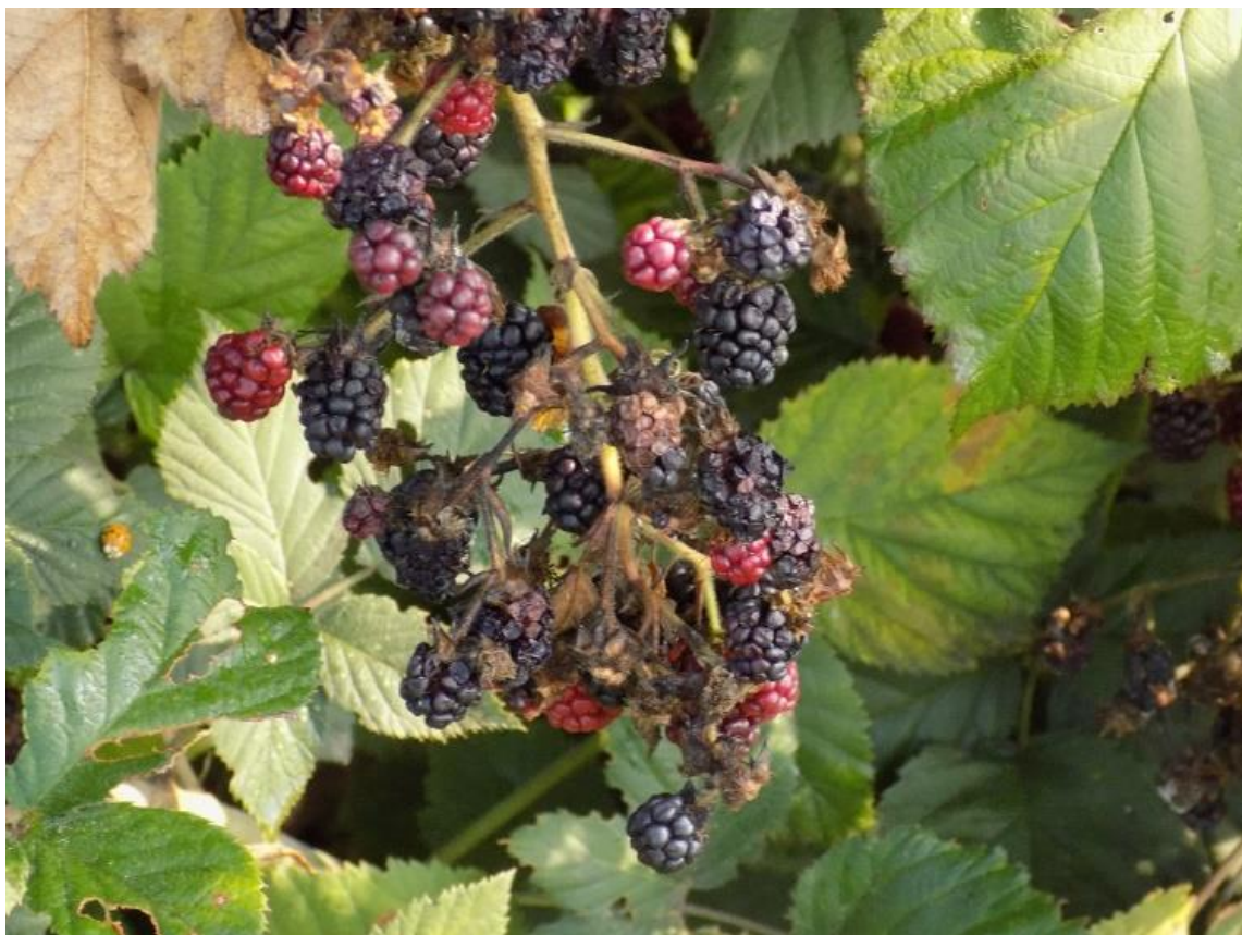
SLIKA 2. OŠTEĆENJA OD D.suzukii NA KUPINI

TOKOM PROTEKLE NEDELJE, NA LOVNIM KLOPKAMA ZA MONITORING AZIJSKE VOĆNE MUŠICE DOŠLO JE DO NAGLOG POVEĆANJA ULOVA ODRASLIH JEDINKI U ODNOSU NA PERIOD PRE TOGA KADA SU SE REGISTROVALE SAMO POJEDINAČNE BROJNOSTI.