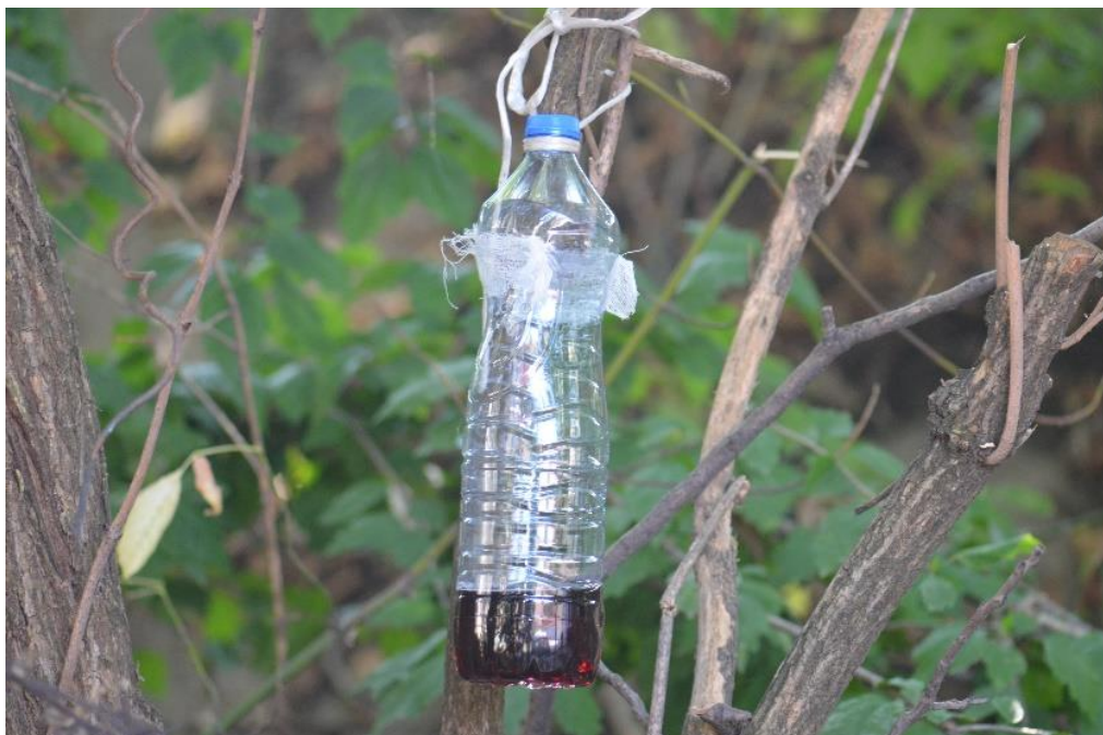
SLIKA 5. KLOPKA ZA D.suzukii