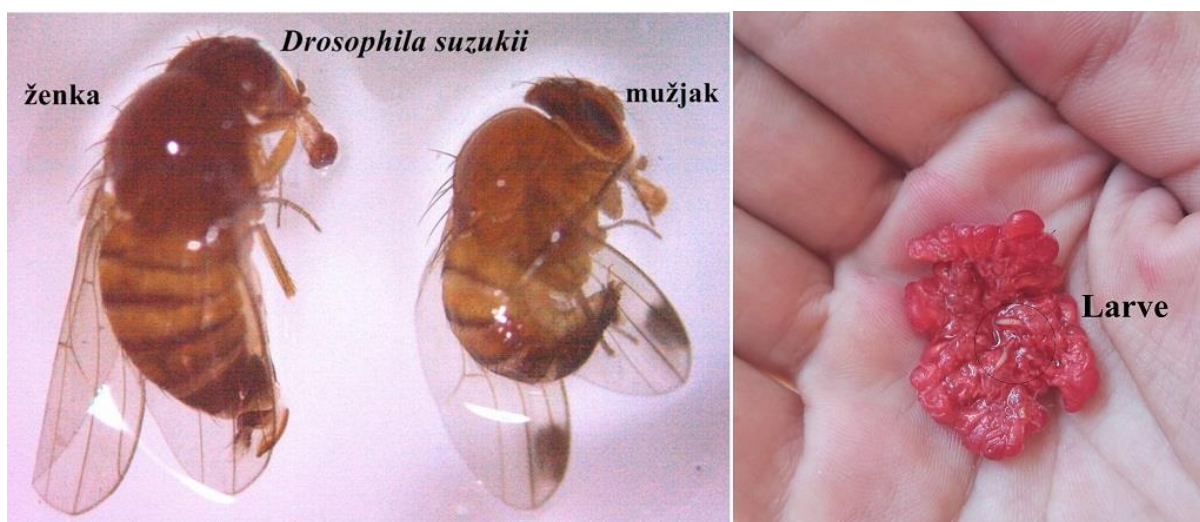
SLIKA 1. ODRASLE JEDINKE D.suzukii I ŠTETE NA PLODU MALINE

AZIJSKA VOĆNA MUŠICA JE ŠTETOČINA JAGODIČASTOG VOĆA, KOŠTIČAVOG VOĆA I VINOVE LOZE. BILNE VRSTE KOJE NAPADA OVA ŠTETOČINA NAJOSETLJIVIJE SU U FAZAMA ZRENJA. ŽENKE POLAŽU JAJA U ZDRAVE PLODOVE. LARVE SE HRANE I RAZVIJAJU UNUTAR PLODOVA I DOLAZI DO NJIHOVOG POTPUNOG UNIŠTENJA. NA POKOŽICI PLODA, GDE ŽENKA POLAŽE JAJA, DOLAZI DO POVREDA I TAKVI PLODOVI SU PODLOŽNI INFEKCIJAMA RAZLIČITIM PROUZROKOVAČIMA TRULEŽI. ŠTETE KOJE PROUZROKUJE OVA ŠTETOČINA MOGU BITI I DO 100%.