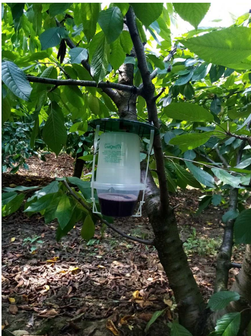
SLIKA 3. KLOPKA ZA D.suzukii