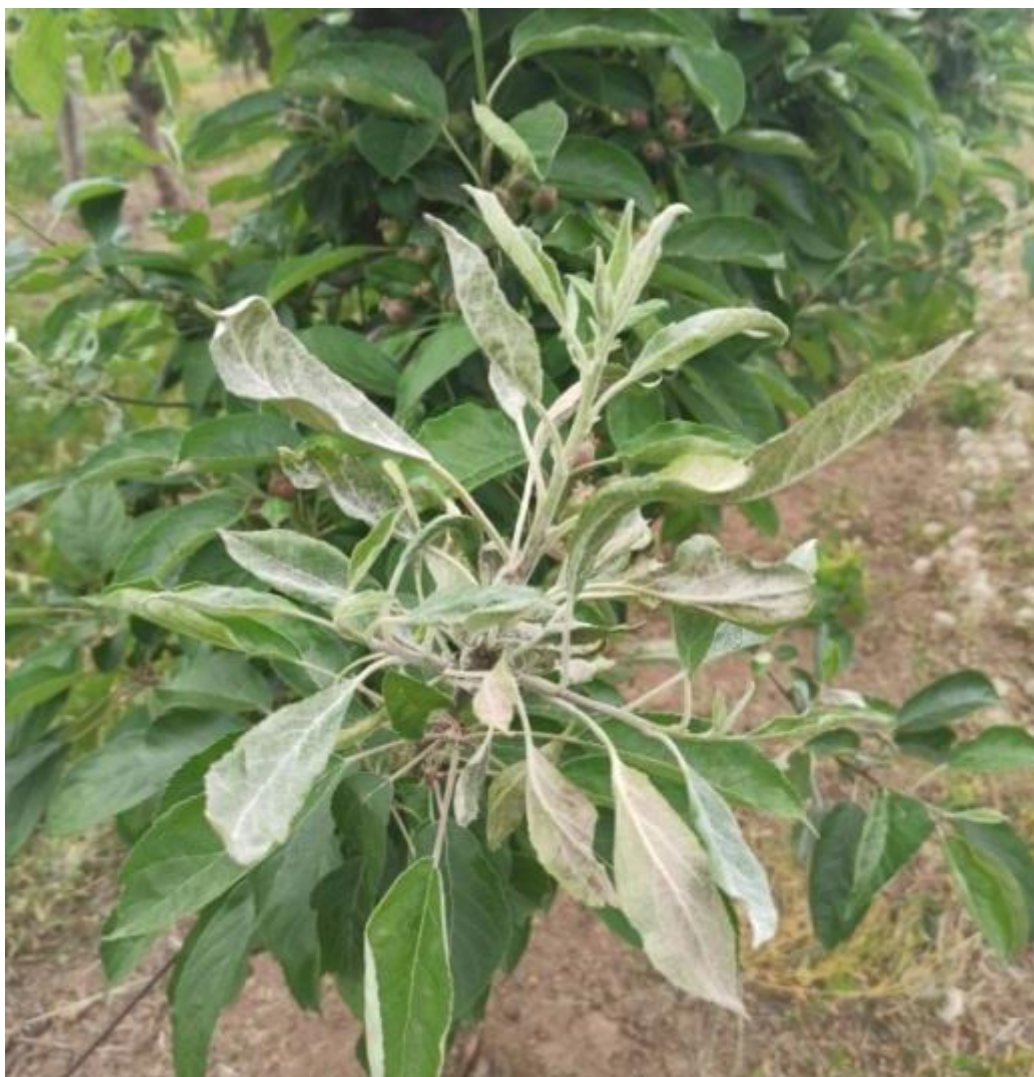
SLIKA 5. SIMPTOM PEPELNICE JABUKE