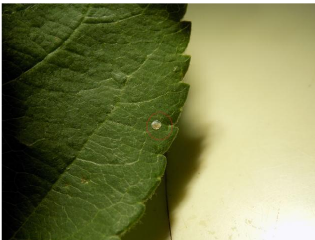
SLIKA 7. POLOŽENO JAJE JABUKINOG SMOTAVCA NA LISTU