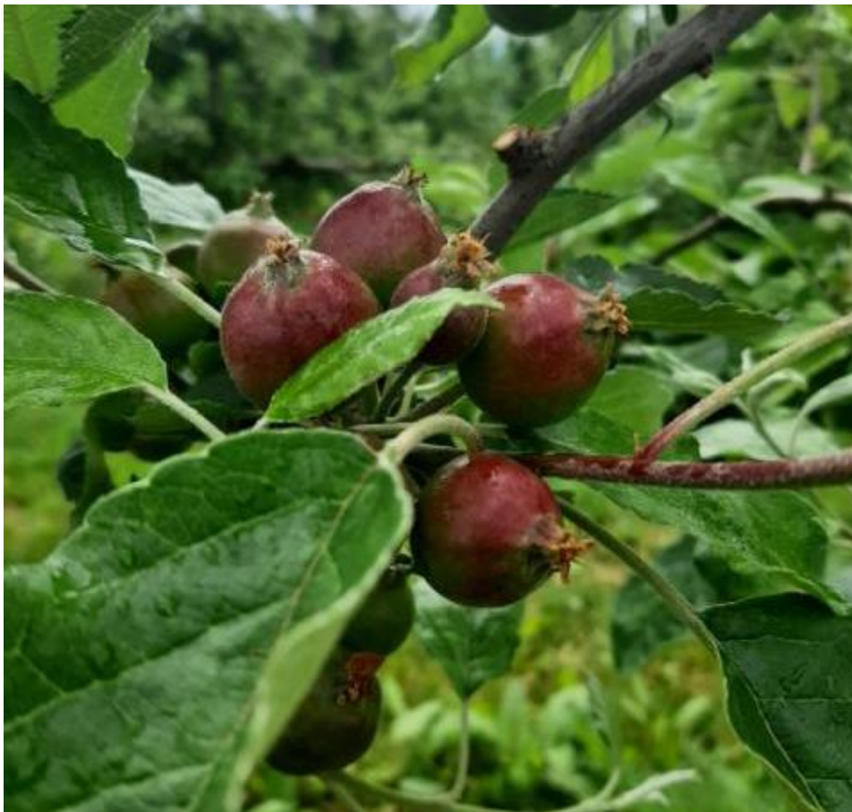
SLIKA 1. FAZA RAVOJA JABUKA

NA PODRUČJU VOJVODINE ZASADI JABUKA SE NALAZE U FAZI RAZVOJA PLODA, PLODOVI SU DOSTIGLI DIMENZIJE OD 10 DO 20 MILIMETARA.