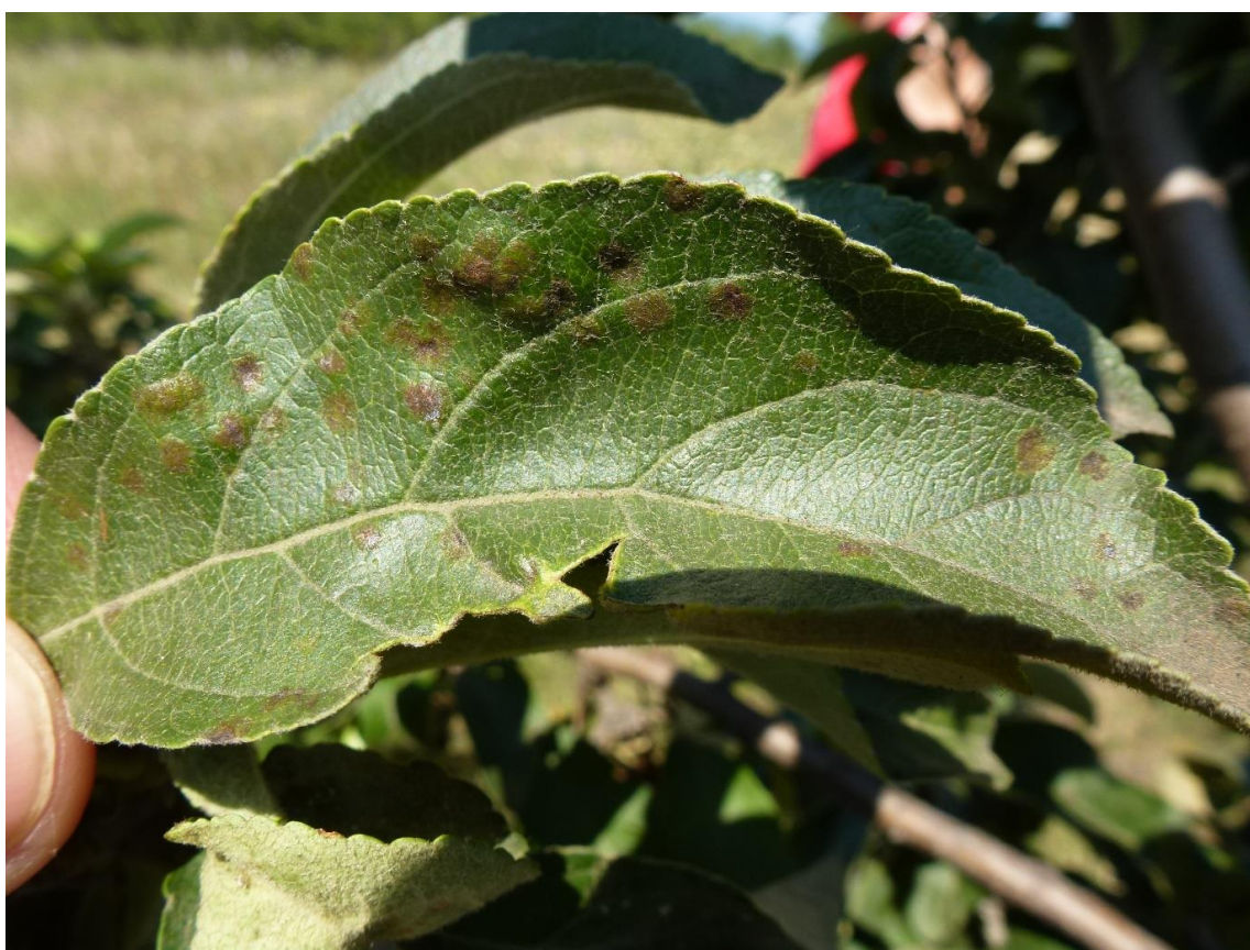
SLIKA 3. SIMPTOM ČAĐAVE PEGAVOSTI NA LISTU JABUKE