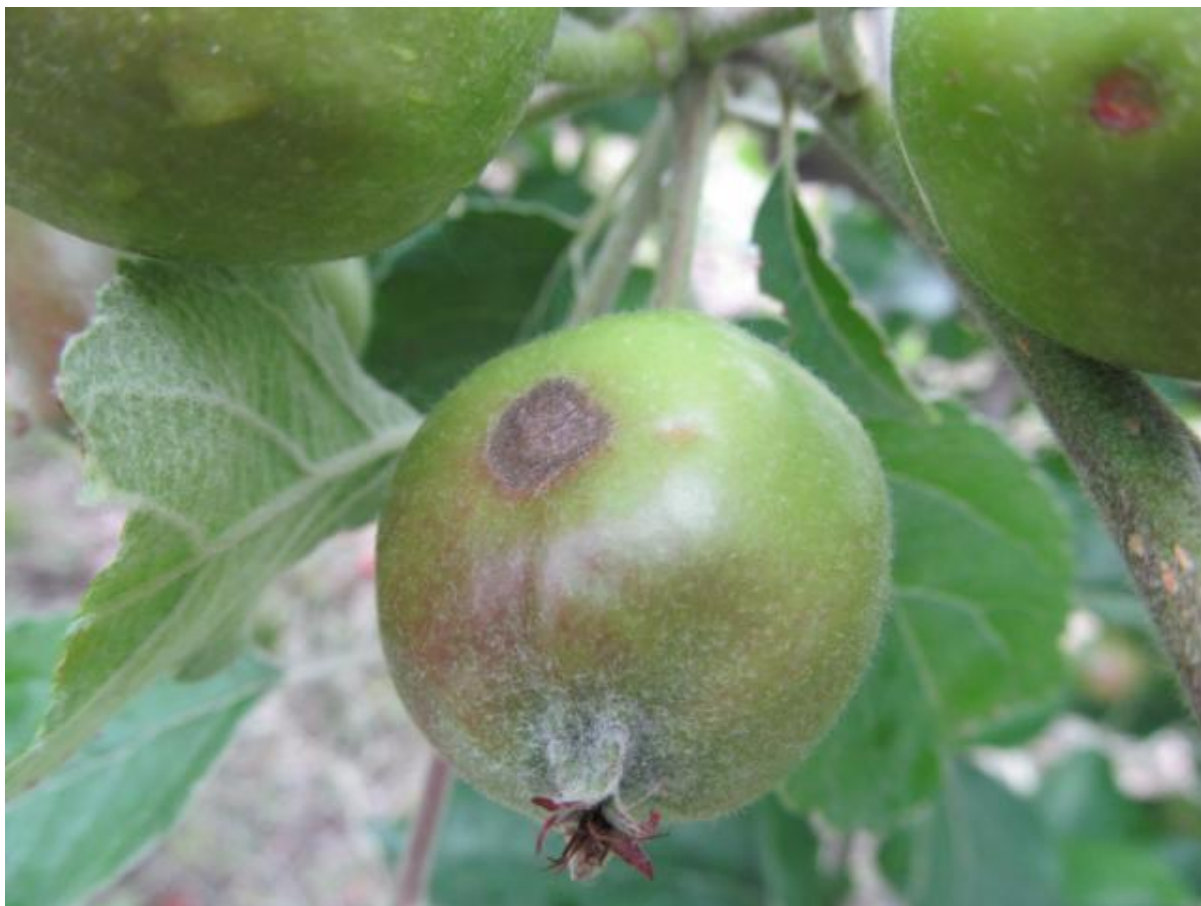
SLIKA 4. SIMPTOM ČAĐAVE KRASTAVOSTI NA PLODU JABUKE