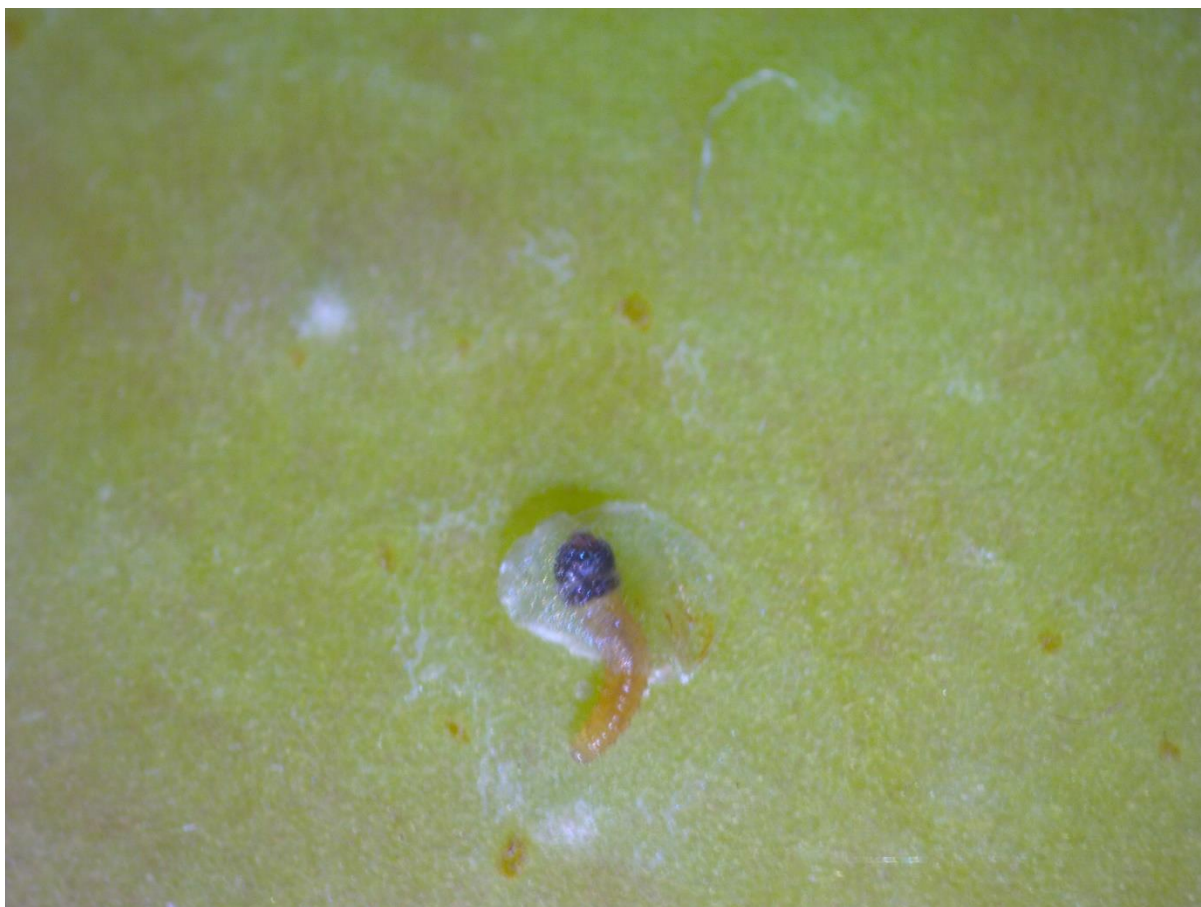
SLIKA 3. TEK ISPIJENA LARVA JABUKINOG SMOTAVCA