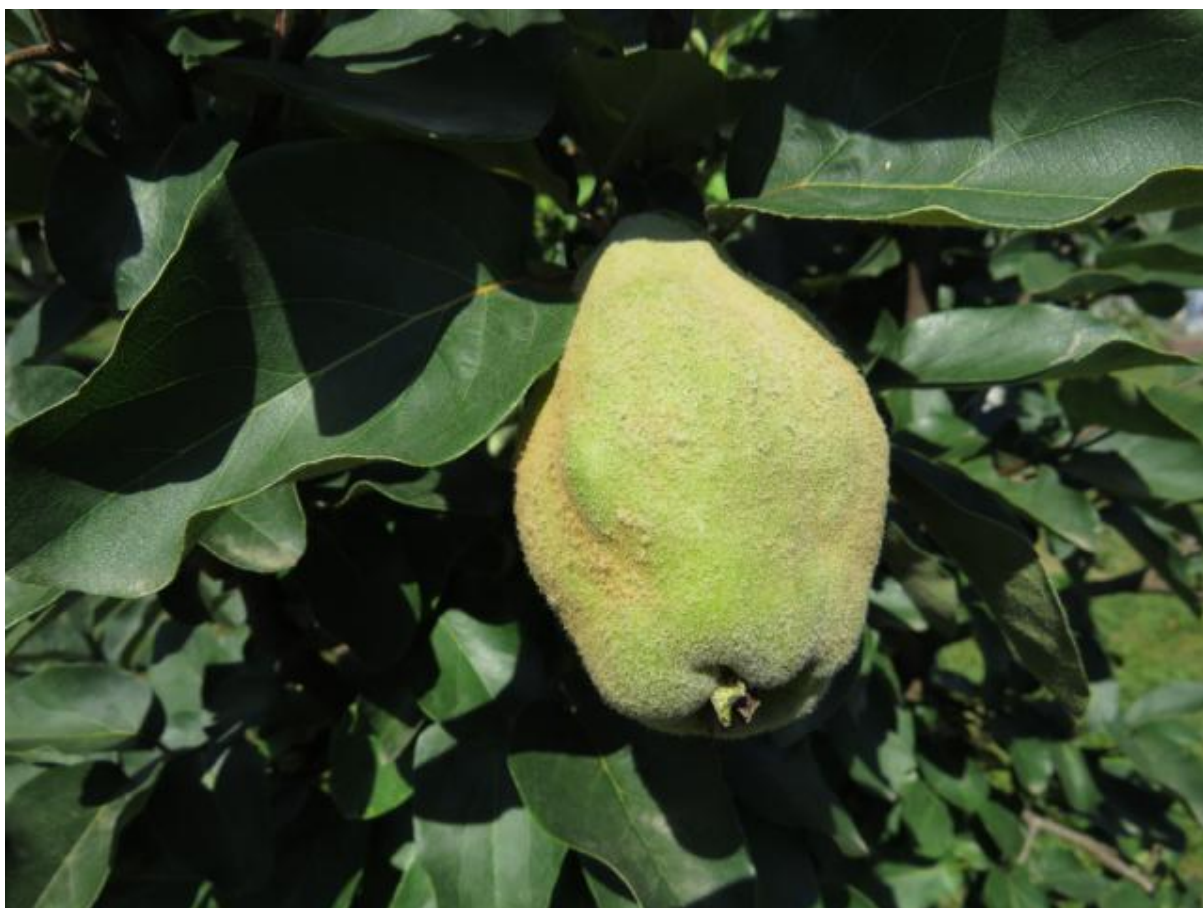
SLIKA 1. FAZA RAZVOJA DUNJE