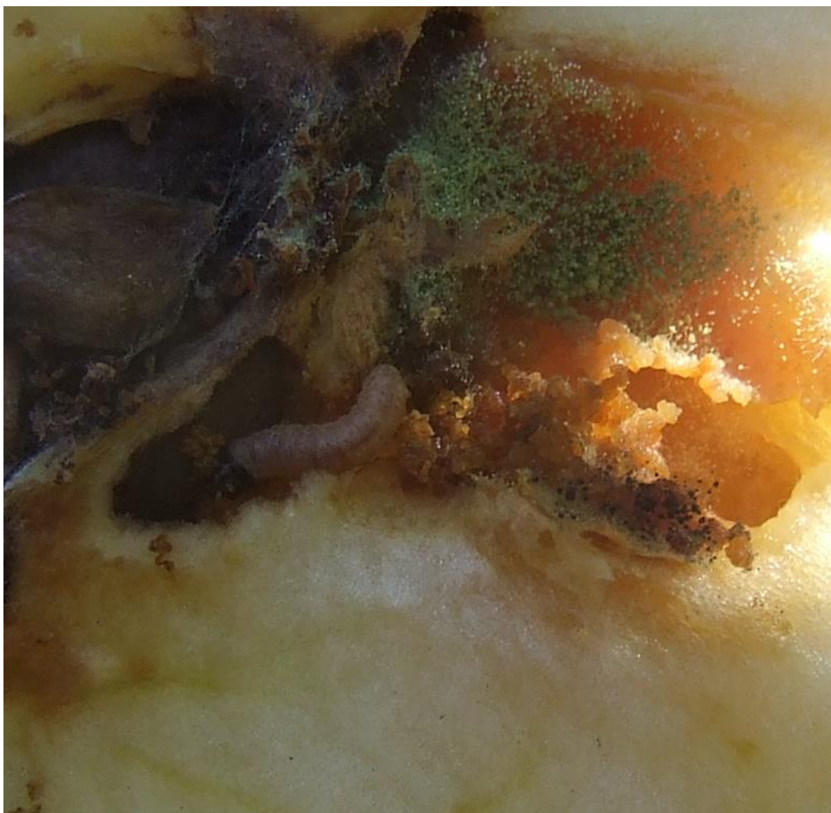
SLIKA 3. LARVA JABUKINOG SMOTAVCA I ŠTETE OD ISHRANE