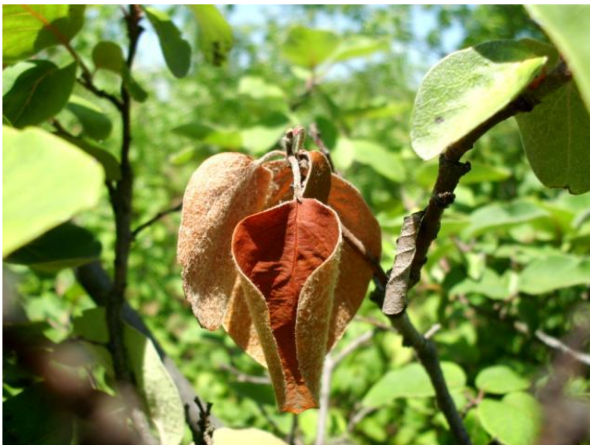
SLIKA 7. SIMPTOMI BAKTERIOZNE PLAMENJAČE NA DUNJI