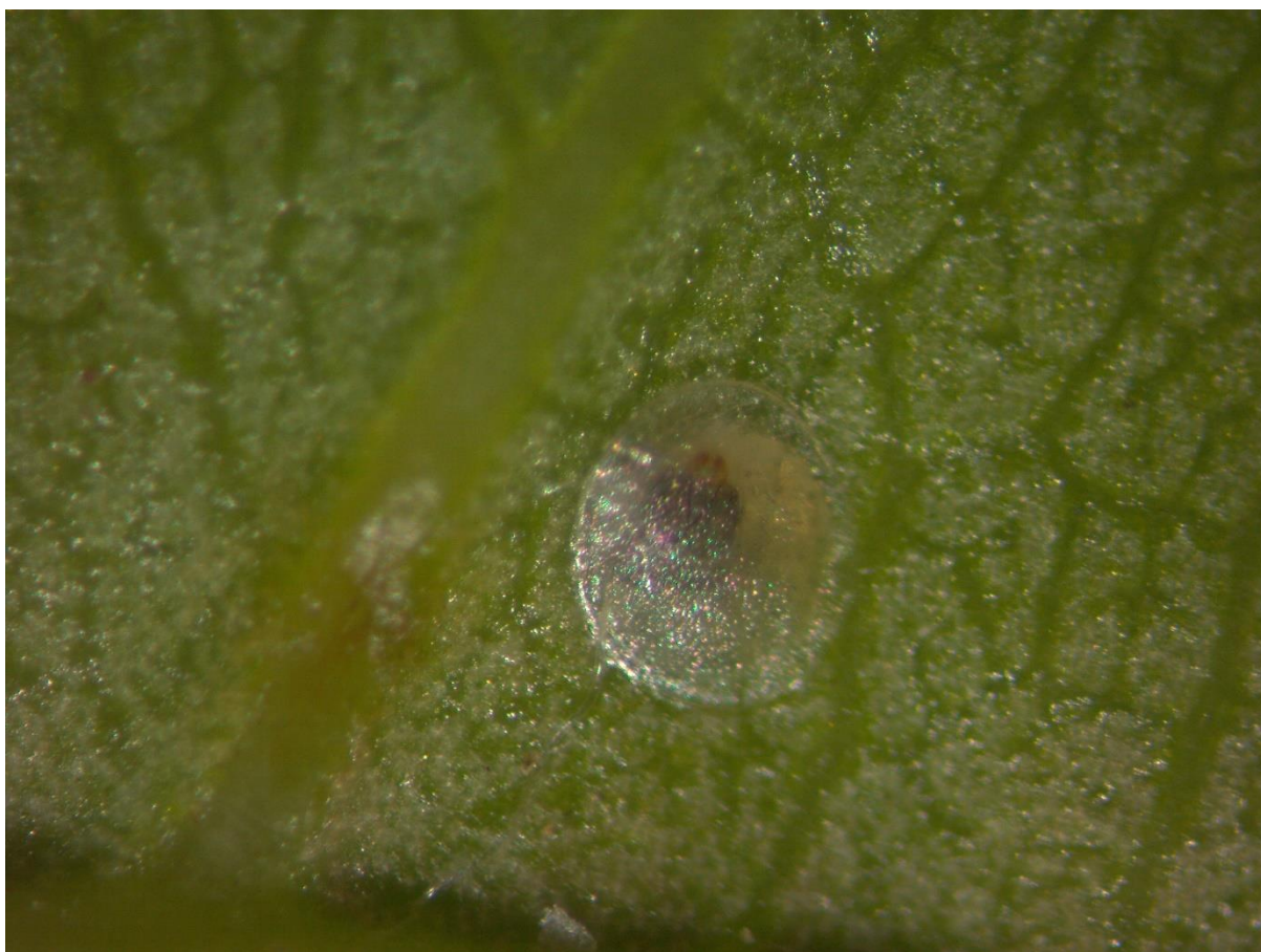
SLIKA 4. JAJE BRESKVINOG SMOTAVCA