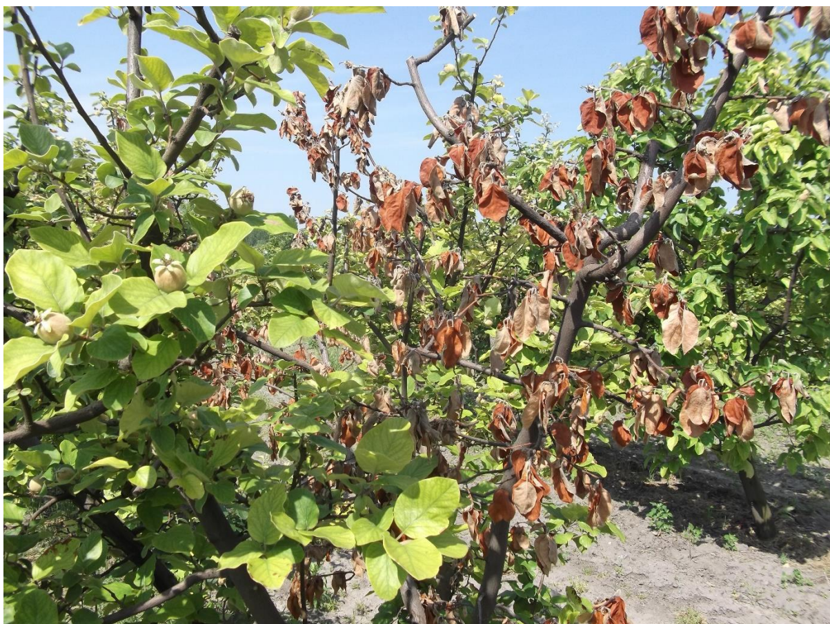
SLIKA 8. SIMPTOMI BAKTERIOZNE PLAMENJAČE NA DUNJI

..... POŠTOVANI POLJOPRIVREDNI PROIZVOĐAČI I POŠTOVANI GLEDAOCI, DETALJNIJE INFORMACIJE O POJAVI ŠTETNIH ORGANIZAMA I MERAMA KONTROLE MOŽETE POGLEDATI NA SAJTU PROGNOZNO IZVEŠTAJNE SLUŽBE ZAŠTITE BILJA VOJVODINE WWW.PISVOJVODINA.COM