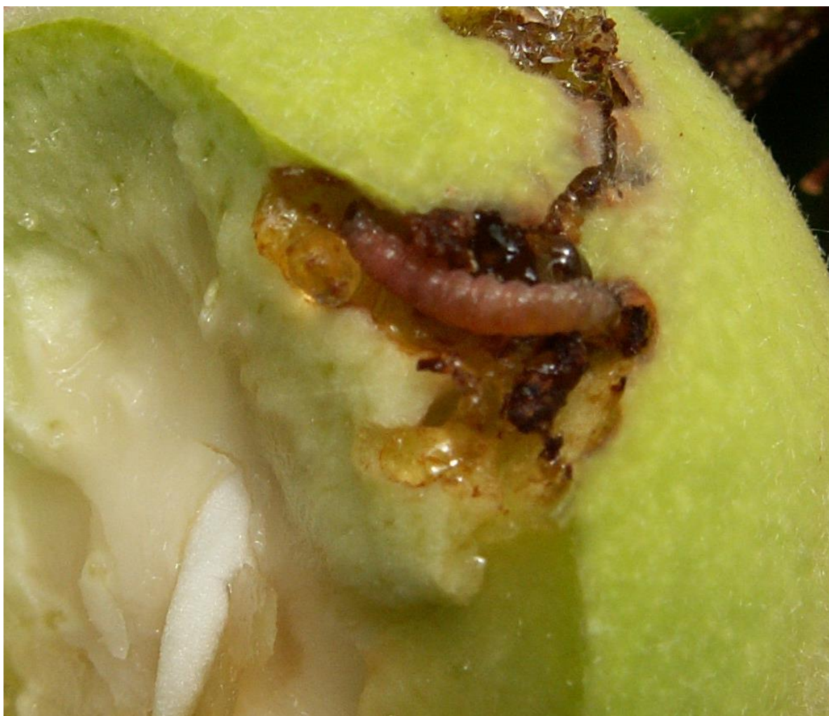
SLIKA 5. LARVA BRESKVINOG SMOTAVCA