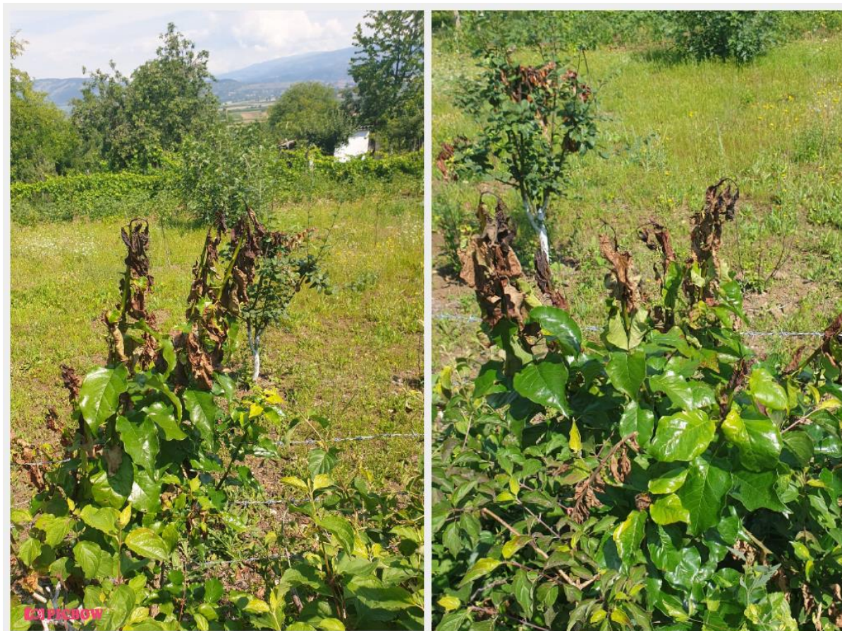
SLIKA 6. SIMPTOMI BAKTERIOZNE PLAMENJAČE NA DUNJI