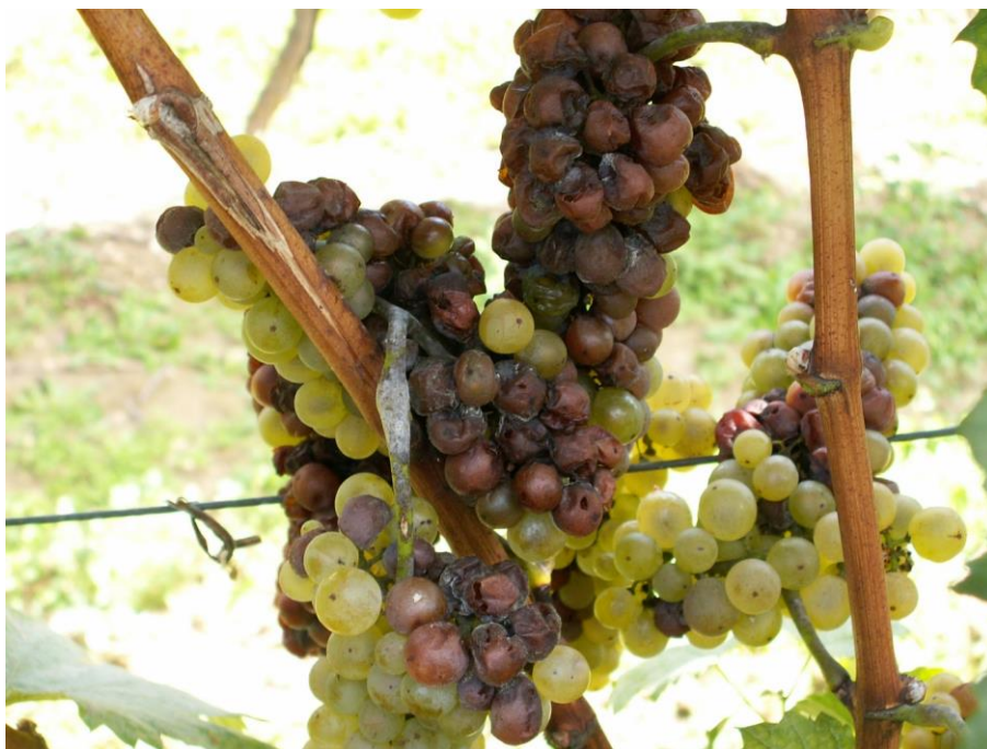
SLIKA 2. ŠTETE NA GROŽĐU

NA MESTIMA GDE ŽENKA PRAVI ZAREZE PRILIKOM POLAGANJA JAJA OTVARA SE PUT ZA INFEKCIJE RAZLIČITIM VRSTAMA PATOGENA PROUZROKOVAČA TRULEŽI.