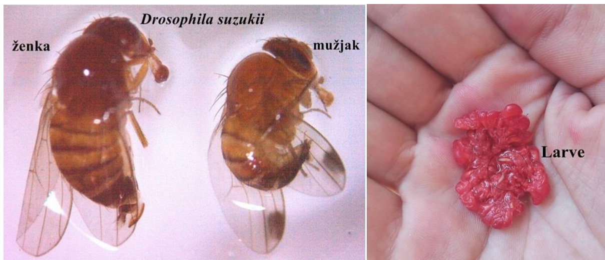
SLIKA 1. ODRASLE JEDINKE I LARVE U PLODOVIMA MALINE

AZIJSKA VOĆNA MUŠICA JE ŠTETOČINA JAGODIČASTOG VOĆA, KOŠTIČAVOG VOĆA I VINOVE LOZE. BILJNE VRSTE NA KOJIMA SE HRANI OVA VOĆNA MUŠICA U OPASNOSTI SU I NAJOSETLJIVIJE SU U VREME ZRENJA. ŠTETE KOJE MOŽE DA IZAZOVE SU I DO 100%. ŽENKE POLAŽU JAJA U ZDRAVE PLODOVE U FAZI ZRENJA. USLED ISHRANE LARVI PLODOVI POTPUNO PROPADAJU.