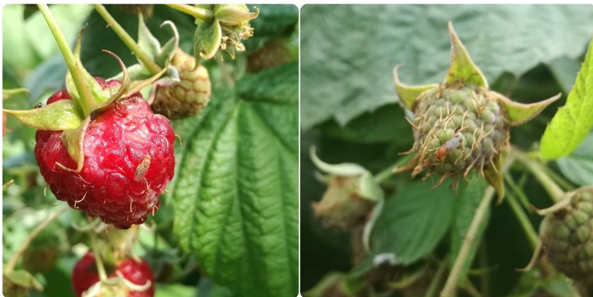
SLIKA 4. IMAGO NA PLODOVIMA MALINE

U FRUŠKOGORSKOJ REGIJI REGISTROVANI SU PRVI ULOVI ODRASLIH JEDINKI AZIJSKE VOĆNE MUŠICE U LOVNIM KLOPKAMA U ZASADIMA MALINA, KUPINA, BRESAKA I VINOVE LOZE. TRENUTNE VREDNOSTI ULOVA ODRASLIH JEDINKI KOJE SE KREĆU DO 3 NA NEDELJNOM NIVOU JOŠ UVEK UKAZUJU NA NIZAK RIZIK OD NASTANKA VELIKIH ŠTETA.