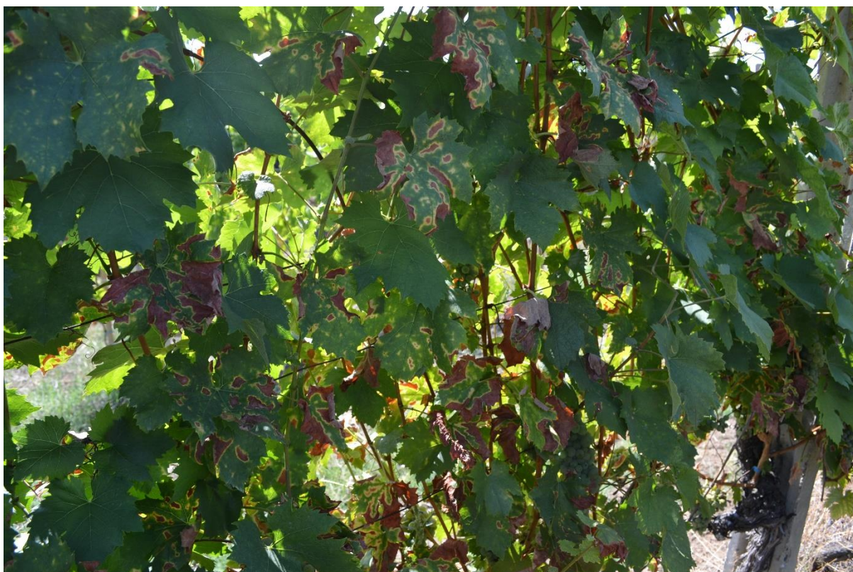
SLIKA 5. SIMPTOMI ESKE

..... POŠTOVANI POLJOPRIVREDNI PROIZVOĐAČI I DRAGI GLEDAOCI, DETALJNIJE INFORMACIJE O POJAVI ŠTETNIH ORGANIZAMA I MERAMA KONTROLE MOŽETE POGLEDATI NA SAJTU PROGNOZNO IZVEŠTAJNE SLUŽBE ZAŠTITE BILJA VOJVODINE WWW.PISVOJVODINA.COM