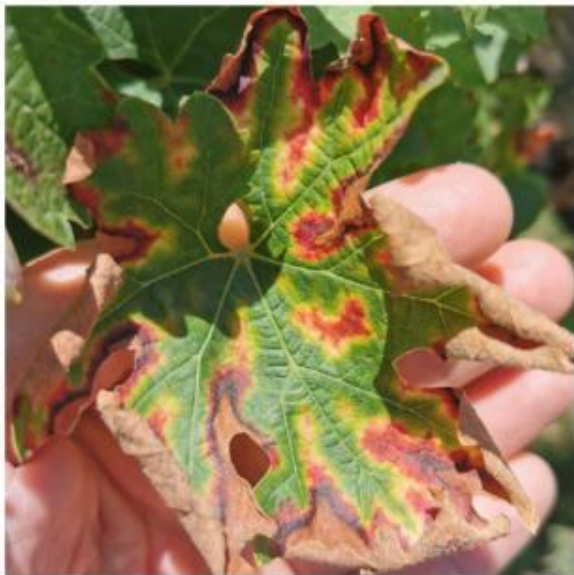
SLIKA 2. SIMPTOMI ESKE