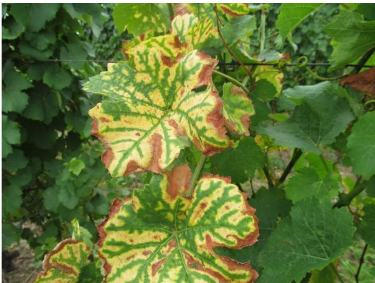
SLIKA 3. SIMPTOMI ESKE