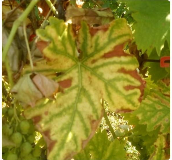
SLIKA 1. SIMPTOMI ESKE