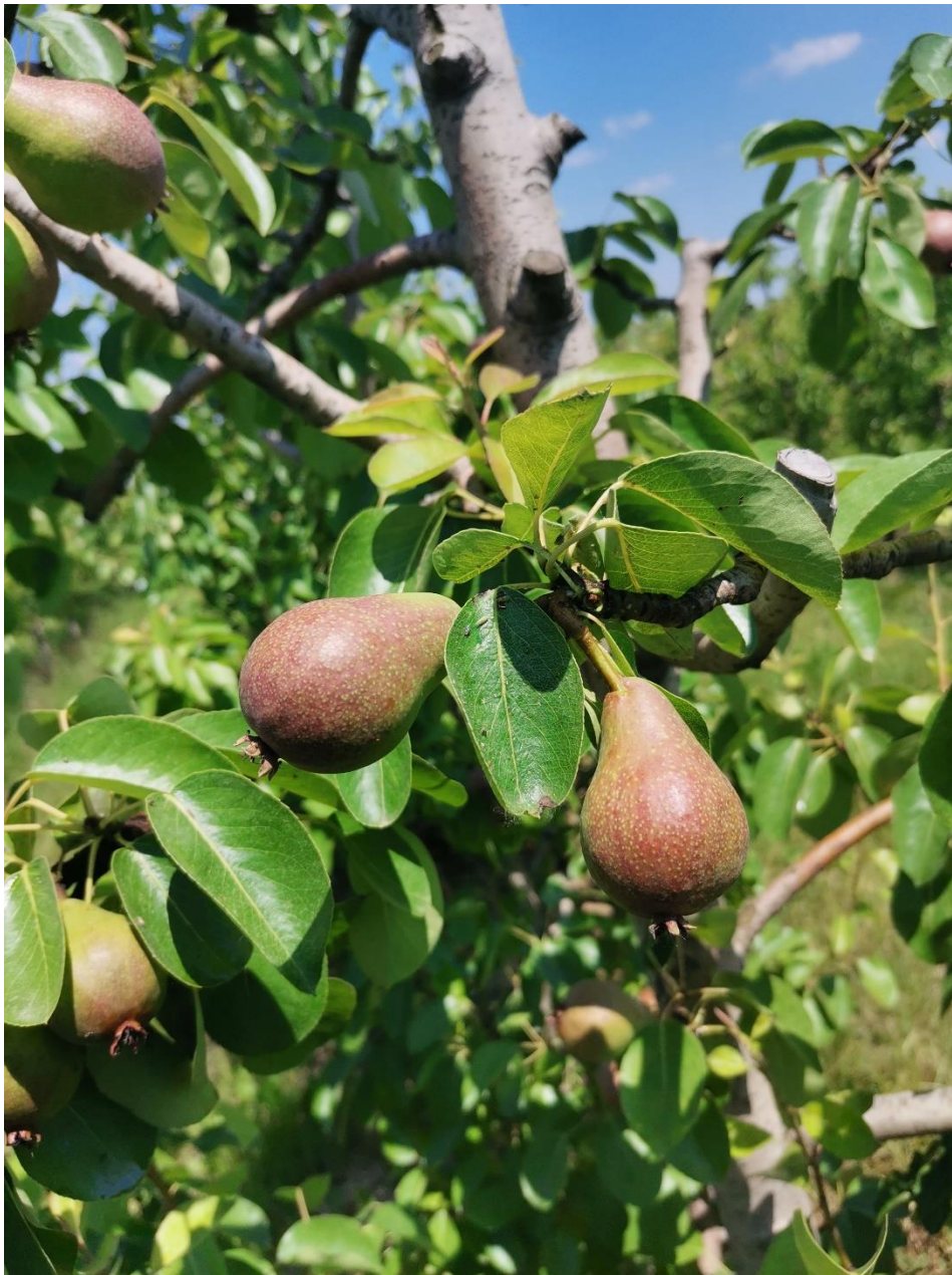
SLIKA 1: FAZA RAZVOJA KRUŠKE

NA PODRUČJU VOJVODINE KRUŠKE SE, U ZAVISNOSTI OD SORTIMENTA I LOKALITETA, NALAZE U RAZLIČITIM FAZAMA RAZVOJA PLODA: PLODOVI DOSTIGLI DIMENZIJE OD 40 MM DO POLOVINE KRAJNJE VELIČINE.