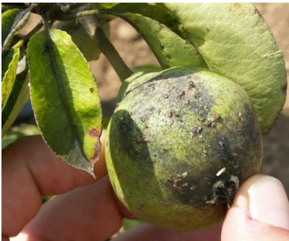
SLIKA 3. ŠTETE OD OBIČNE KRUŠKINE BUVE NA PLODU