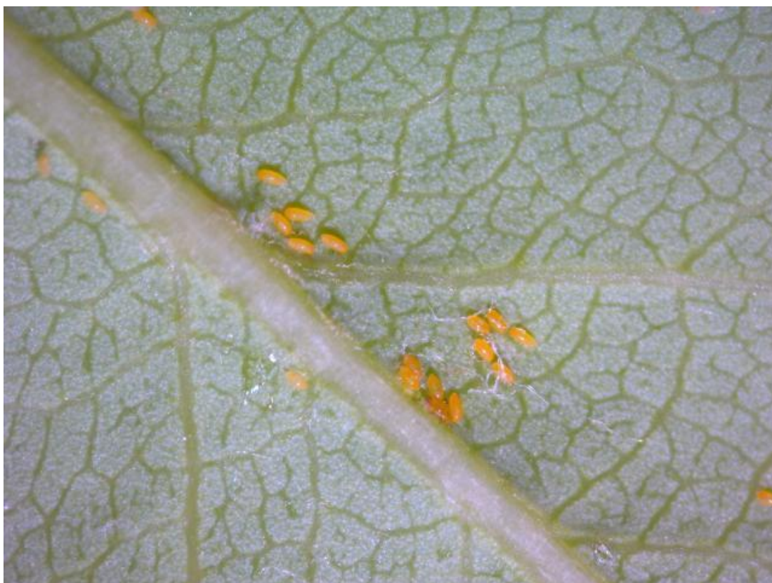
SLIKA 4. JAJA OBIČNE KRUŠKINE BUVE