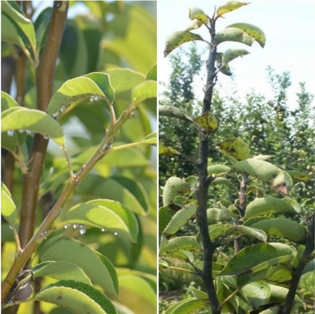
SLIKA 2: SIMPTOMI CURENJA MEDNE ROSE I NASELJAVANJA GLJIVE ČAĐAVICE

OBIČNA KRUŠKINA BUVA JE NAJZNAČAJNIJA ŠTETOČINA KRUŠKE NA NAŠEM PODRUČJU. GLAVNI JE PROBLEM U INTENZIVNOJ PROIZVODNJI KRUŠAKA. ŠTETE NANOSE LARVE KOJE SISAJU SOKOVE BILJAKA, A VIŠAK HRANE IZLUČUJU U VIDU MEDNE ROSE NA KOJU SE NASELJAVA GLJIVA ČAĐAVICA. ČAĐAVI BILJNI DELOVI SMANJUJU ASIMILACIONU POVRŠINU ŠTO SE ODRAŽAVA NA SMANJENJE PRINOSA, A ČAĐAVI PLODOVI IMAJU MANJU TRŽIŠNU VREDNOST.