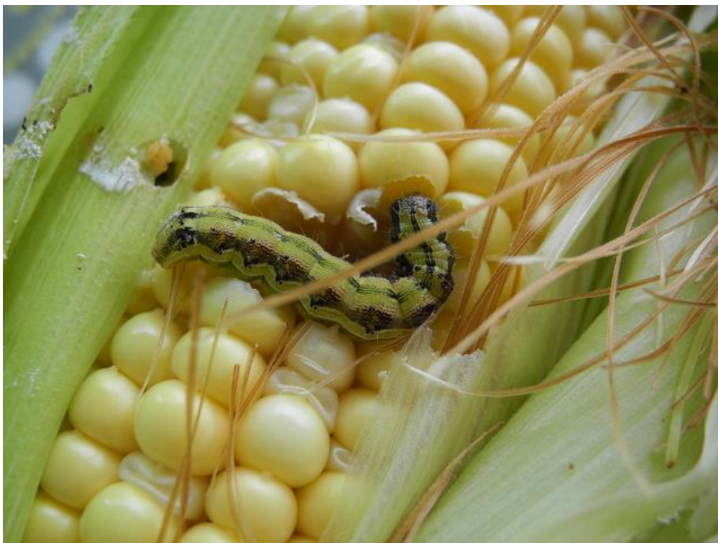
SLIKA 5. GUSENICA PAMUKOVE SOVICE NA KUKURUZU