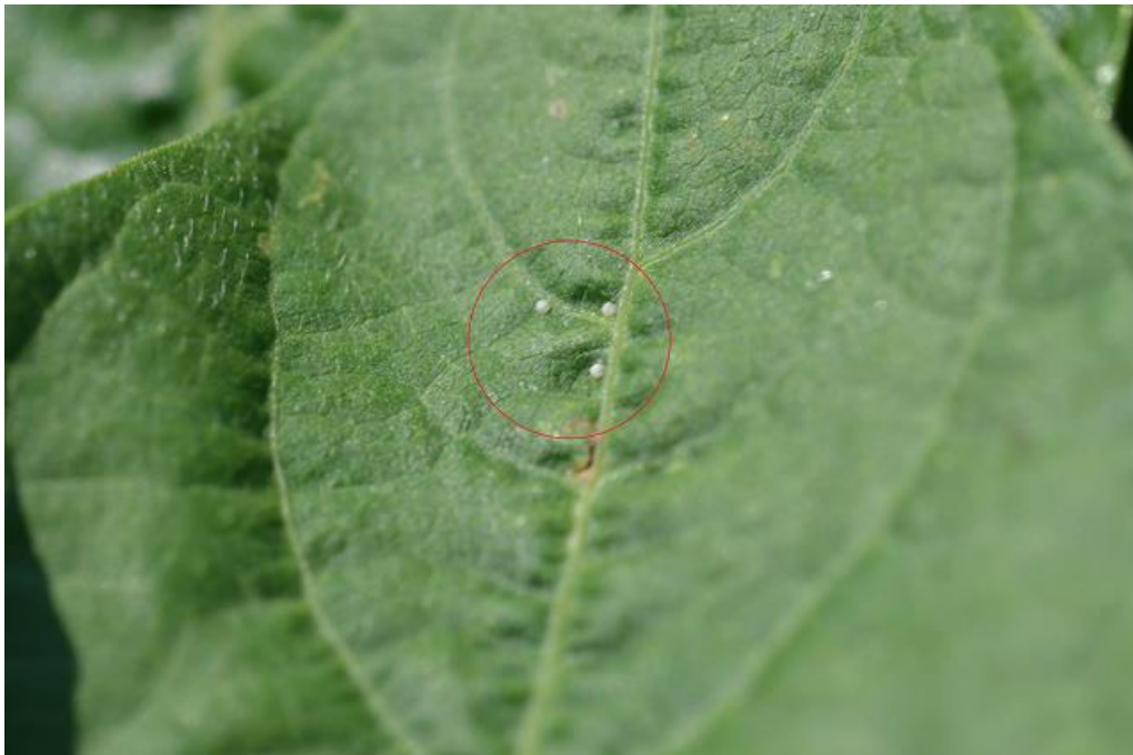
SLIKA 4. POLOŽENA JAJA NA LISTU BORANIJE