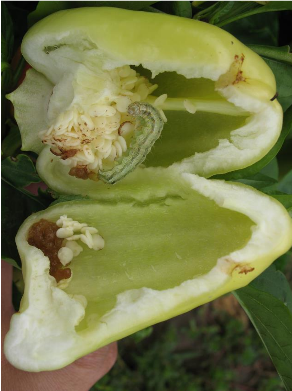
SLIKA 6. GUSENICA PAMUKOVE SOVICE U PLODU PAPRIKE

..... POŠTOVANI POLJOPRIVREDNI PROIZVOĐAČI I DRAGI GLEDAOCI, DETALJNIJE INFORMACIJE O POJAVI ŠTETNIH ORGANIZAMA I MERAMA KONTROLE MOŽETE POGLEDATI NA SAJTU PROGNOZNO IZVEŠTAJNE SLUŽBE ZAŠTITE BILJA VOJVODINE WWW.PISVOJVODINA.COM