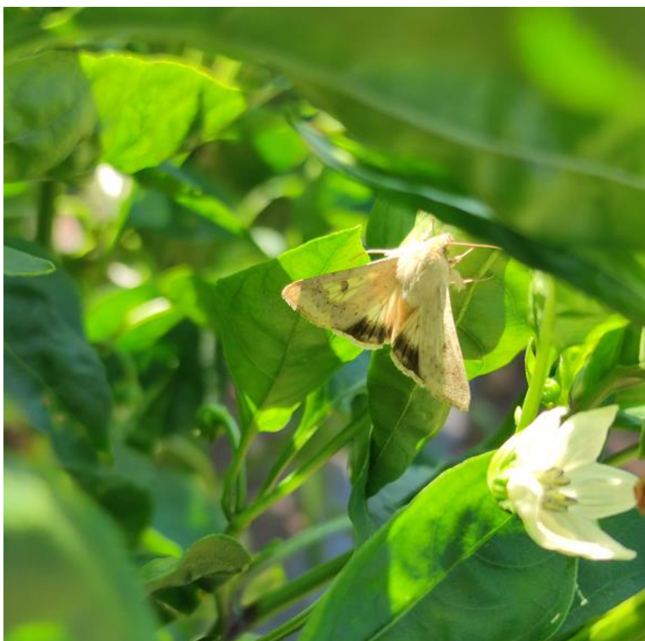
SLIKA 1. ODRASLA JEDNIKA PAMUKOVE SOVICE

PRILIKOM PRIMENE HEMIJSKIH MERA ZAŠTITE OBAVEZNO TREBA VODITI RAČUNA O KARENCI PRIMENJENIH PREPARATA.