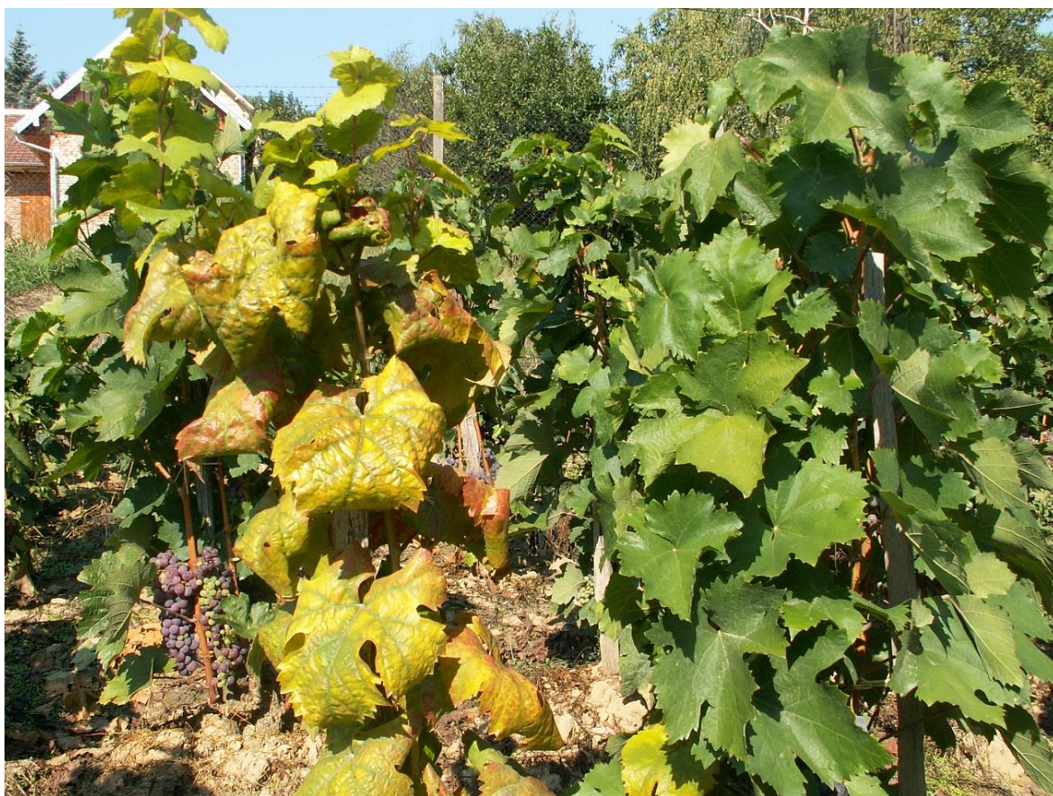
SLIKA 2. SIMPTOM ZLATASTOG ŽUTILA VINOVE LOZE