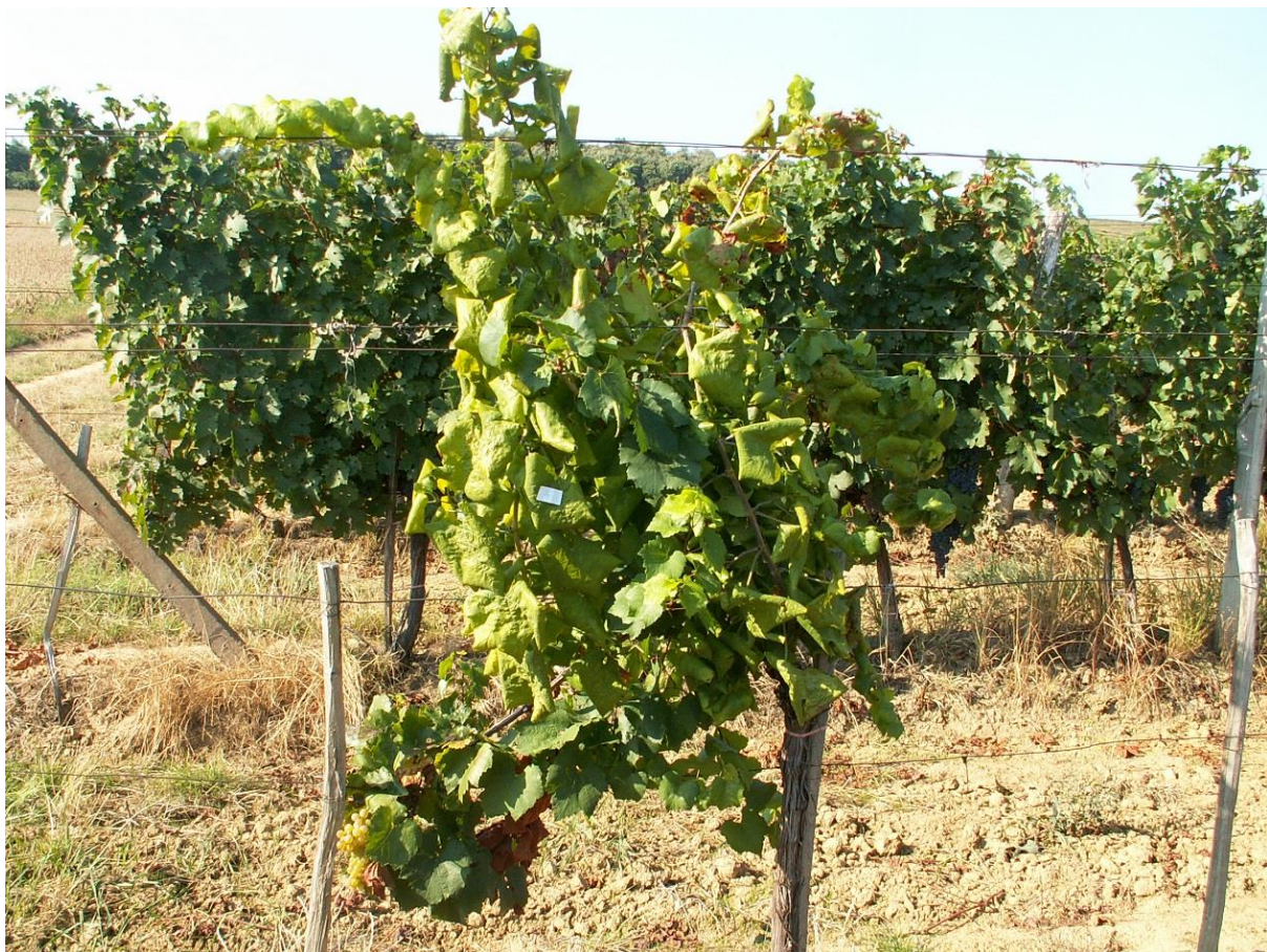
SLIKA 1. SIMPTOM ZLATASTOG ŽUTILA VINOVE LOZE