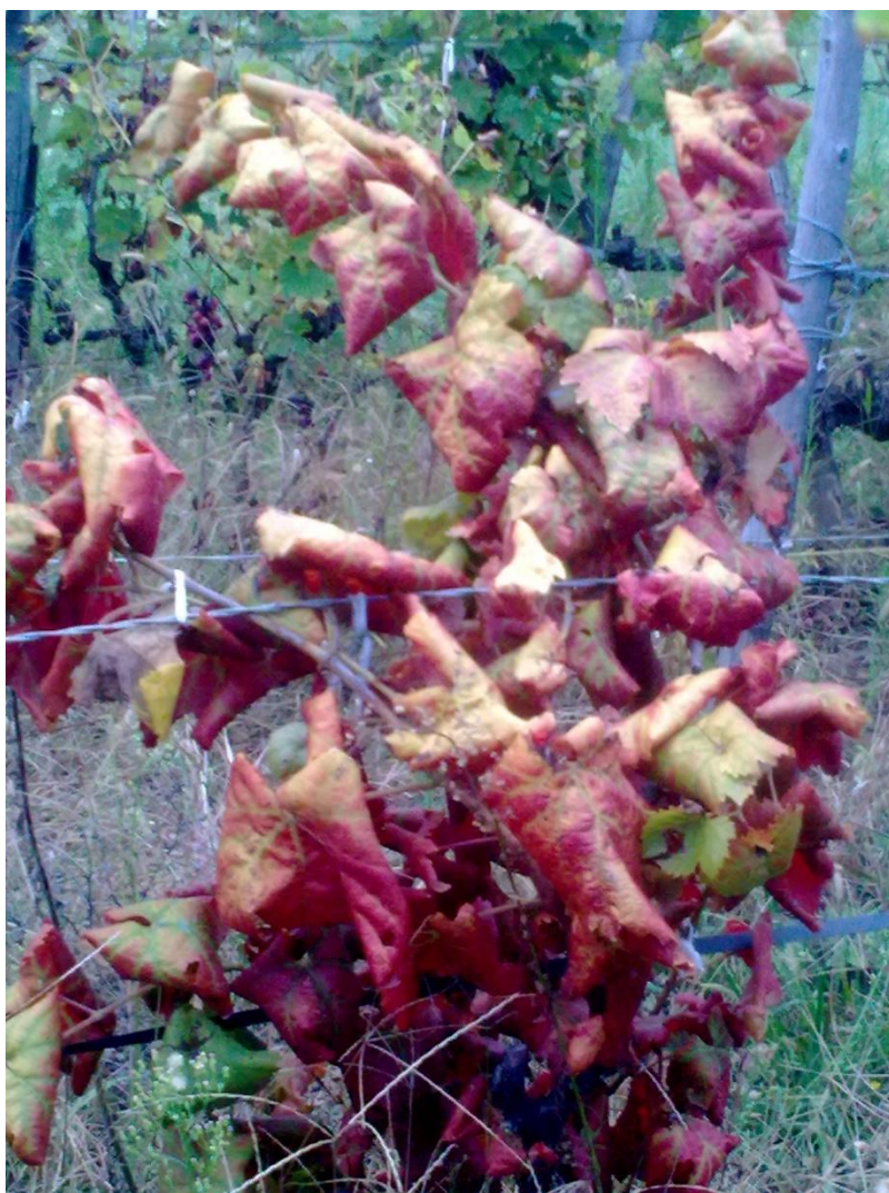
SLIKA 4. SIMPTOM ZLATASTOG ŽUTILA VINOVE LOZE

PRENOSILAC FITOPLAZME JE CIKADA Scaphoideus titanus KOJA U NAŠIM USLOVIMA RAZVIJA JEDNU GENERACIJU GODIŠNJE. ŽENKA POLAŽE JAJA POD KORU DVOGODIŠNJIH LASTARA IZ KOJIH SE PILE LARVE. LARVA PROLAZI KROZ PET RAZVOJNIH STUPNJEVA. NAKON RAZVOJA LARVI, DOLAZI DO POJAVE ODRASLIH JEDINKI.