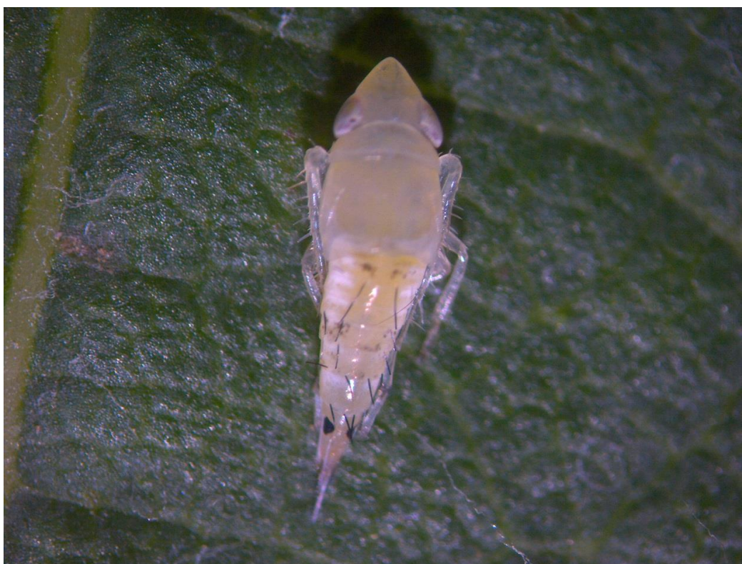
SLIKA 6. LARVA CIKADE Scaphoideus titanus