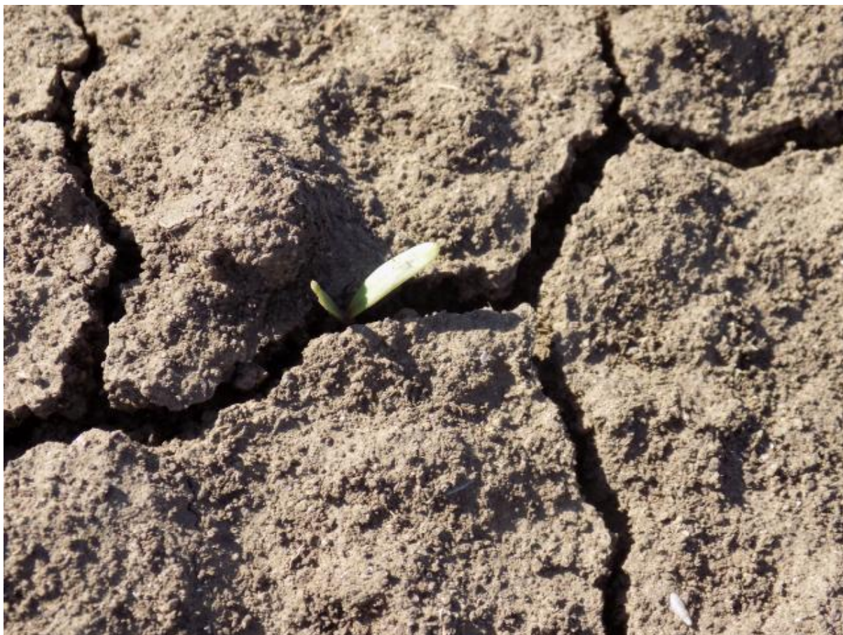
SLIKA 1. FAZA RAZVOJA ŠEĆERNE REPE