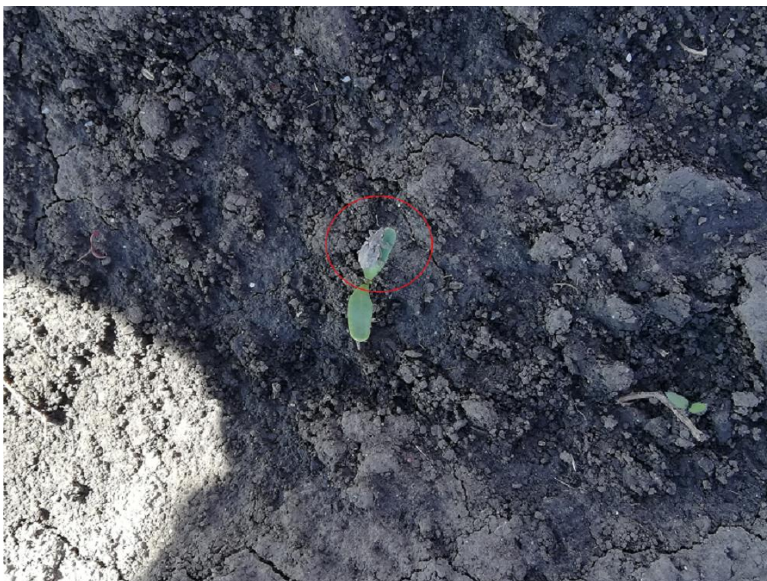
SLIKA 4. ODRASLA JEDINKA KUKURUZNE PIPE