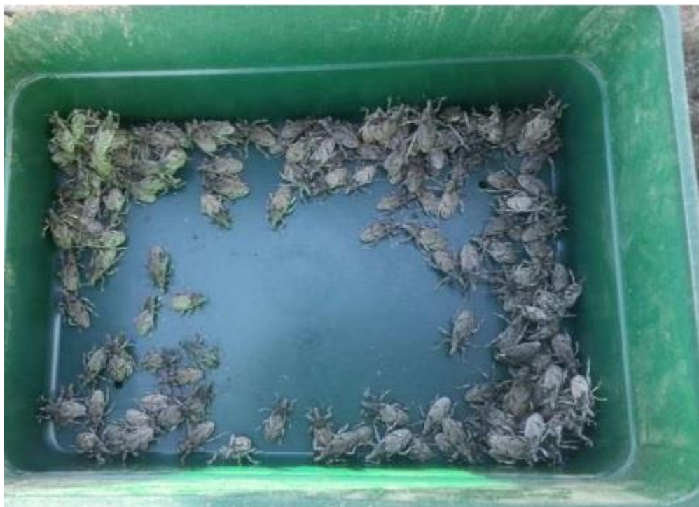
SLIKA 3. ODRASLE JEDINKE REPINE PIPE U FEROMONSKOJ KLOPCI