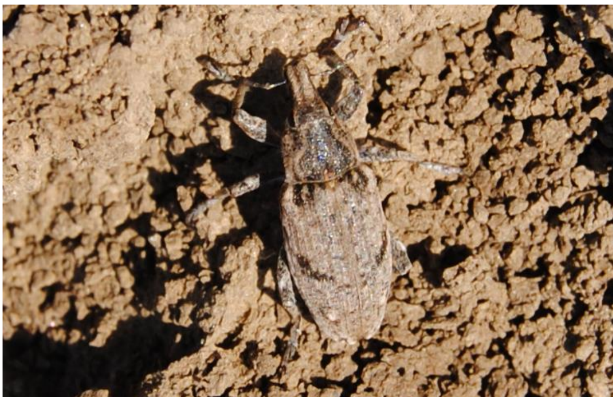
SLIKA 2. ODRASLA JEDINKA REPINE PIPE