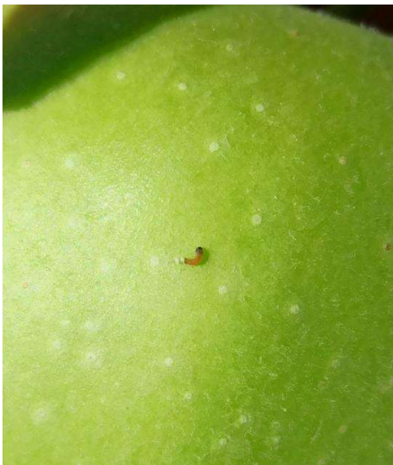
SLIKA 3. LARVA JABUKINOG SMOTAVCA