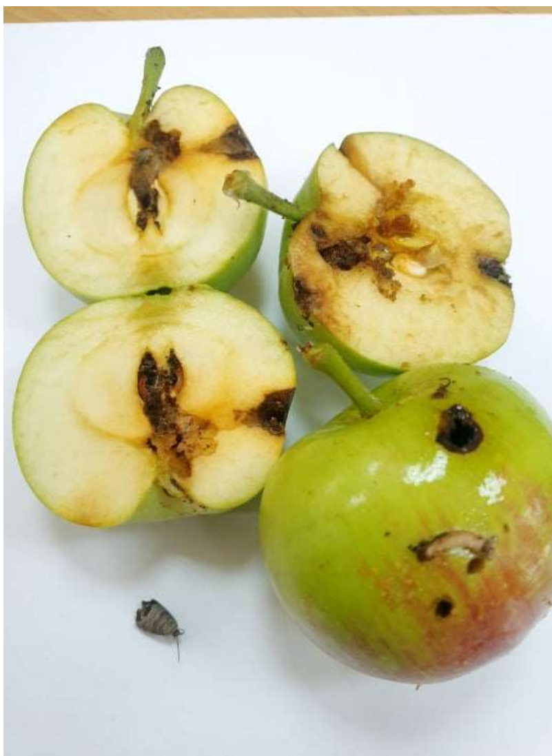
SLIKA 5. ŠTETE NA PLODOVIMA OD JABUKINOG SONTAVCA