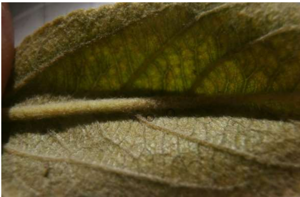
SLIKA 6. GRINJE NA NALIČJU LISTA JABUKE