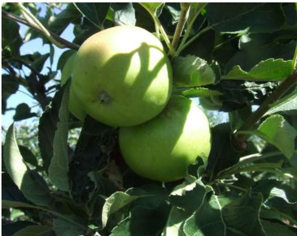
SLIKA 1. FAZA RAZVOJA JABUKE

DETALJNIJE INFORMACIJE O POJAVI ŠTETNIH ORGANIZAMA I MERAMA NJIHOVE KONTROLE MOGU SE POGLEDATI NA PORTALU PROGNOZNO IZVEŠTAJNE SLUŽBE ZAŠTITE BILJA VOJVODINE WWW.PISVOJVODINA.COM