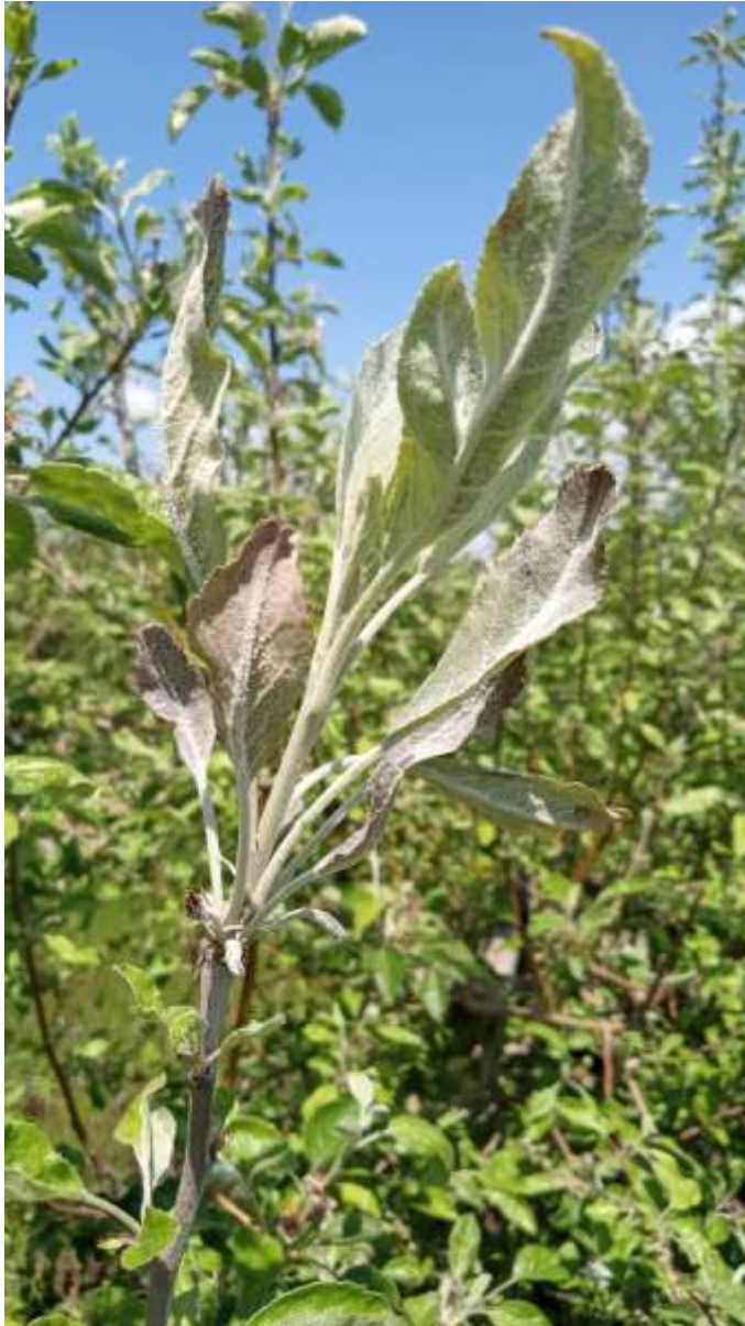
SLIKA 7. SIMPTOM PEPELNICE JABUKE