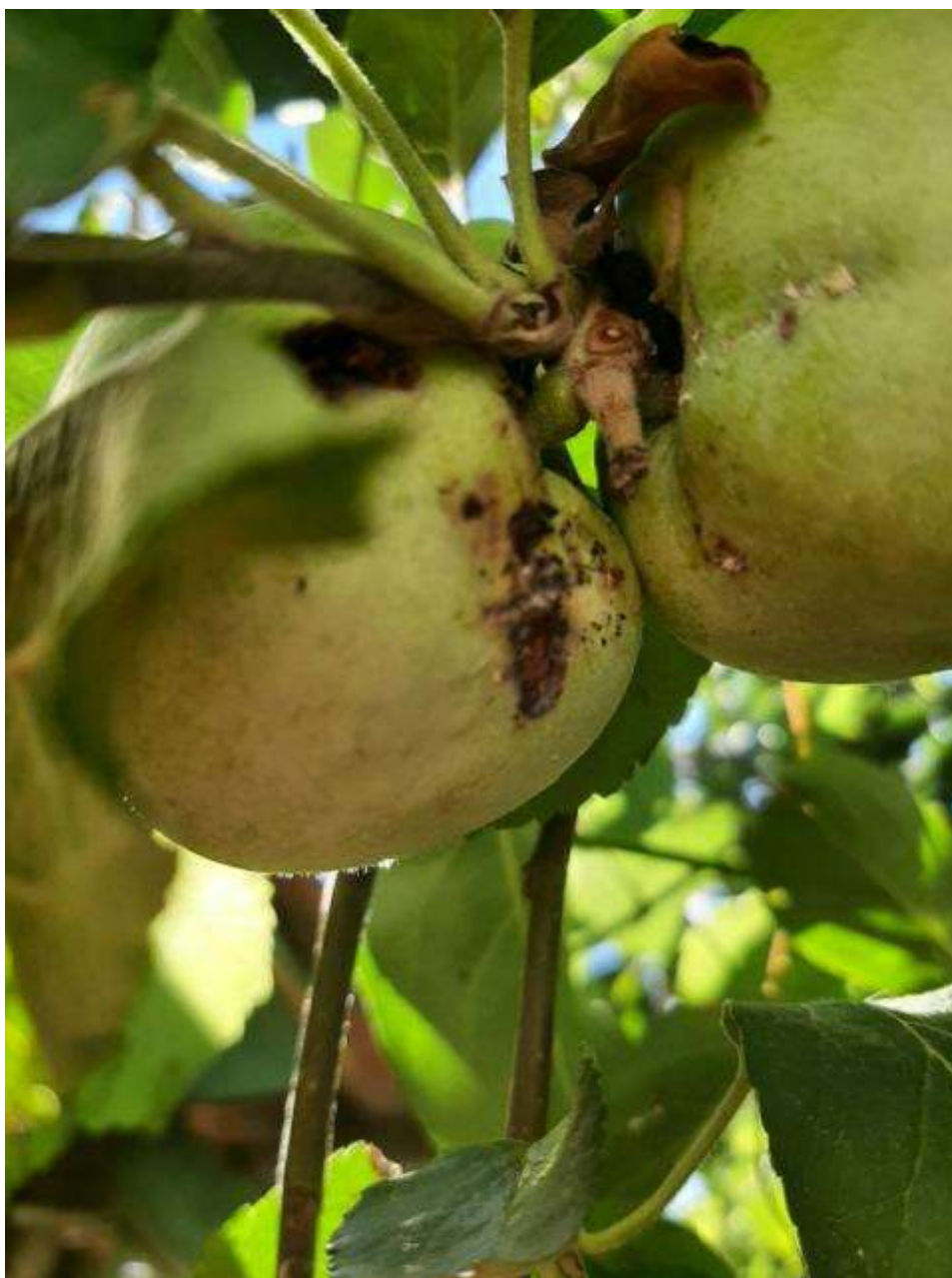
SLIKA 4. ŠTETE NA PLODOVIMA OD JABUKINOG SONTAVCA