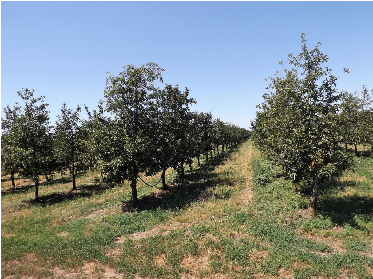
SLIKA 1. ZASAD VIŠNJE

NA TERITORIJI VOJVODINE BERBA VIŠANJA I TREŠANJA JE ZAVRŠENA.