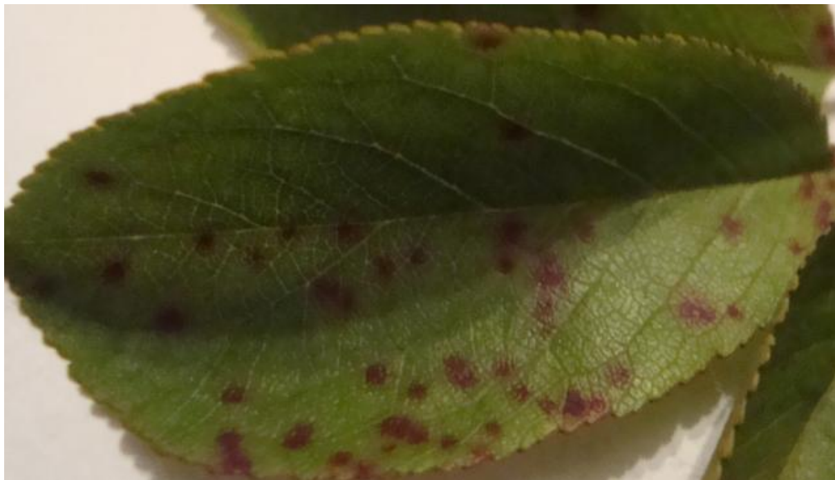
SLIKA 2. SIMPTOMI PEGAVOSTI LIŠĆA NA VIŠNJI

JESENI. OVA GLJIVA UPRAVO I PREZIMLJAVA U OPALOM LIŠĆU PA NAREDNE SEZONE TO JE IZVOR NOVIH INFEKCIJA.