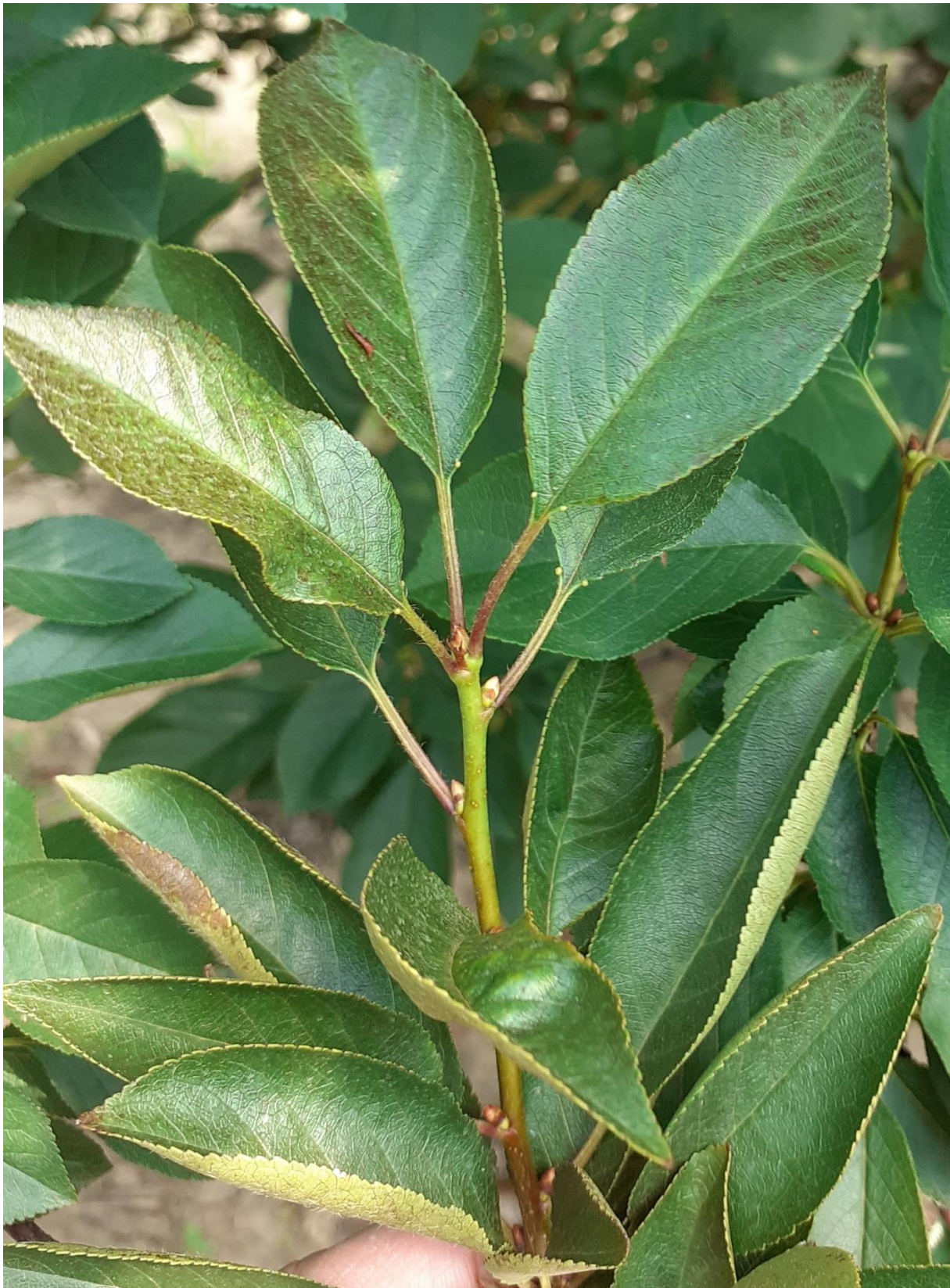
SLIKA 4. SIMPTOM NAPADA GRINJA NA MLADARU VIŠNJE

..... POŠTOVANI POLJOPRIVREDNI PROIZVOĐAČI I DRAGI GLEDAOCI, DETALJNIJE INFORMACIJE O POJAVI ŠTETNIH ORGANIZAMA I MERAMA KONTROLE MOŽETE POGLEDATI NA SAJTU PROGNOZNO IZVEŠTAJNE SLUŽBE ZAŠTITE BILJA VOJVODINE WWW.PISVOJVODINA.COM