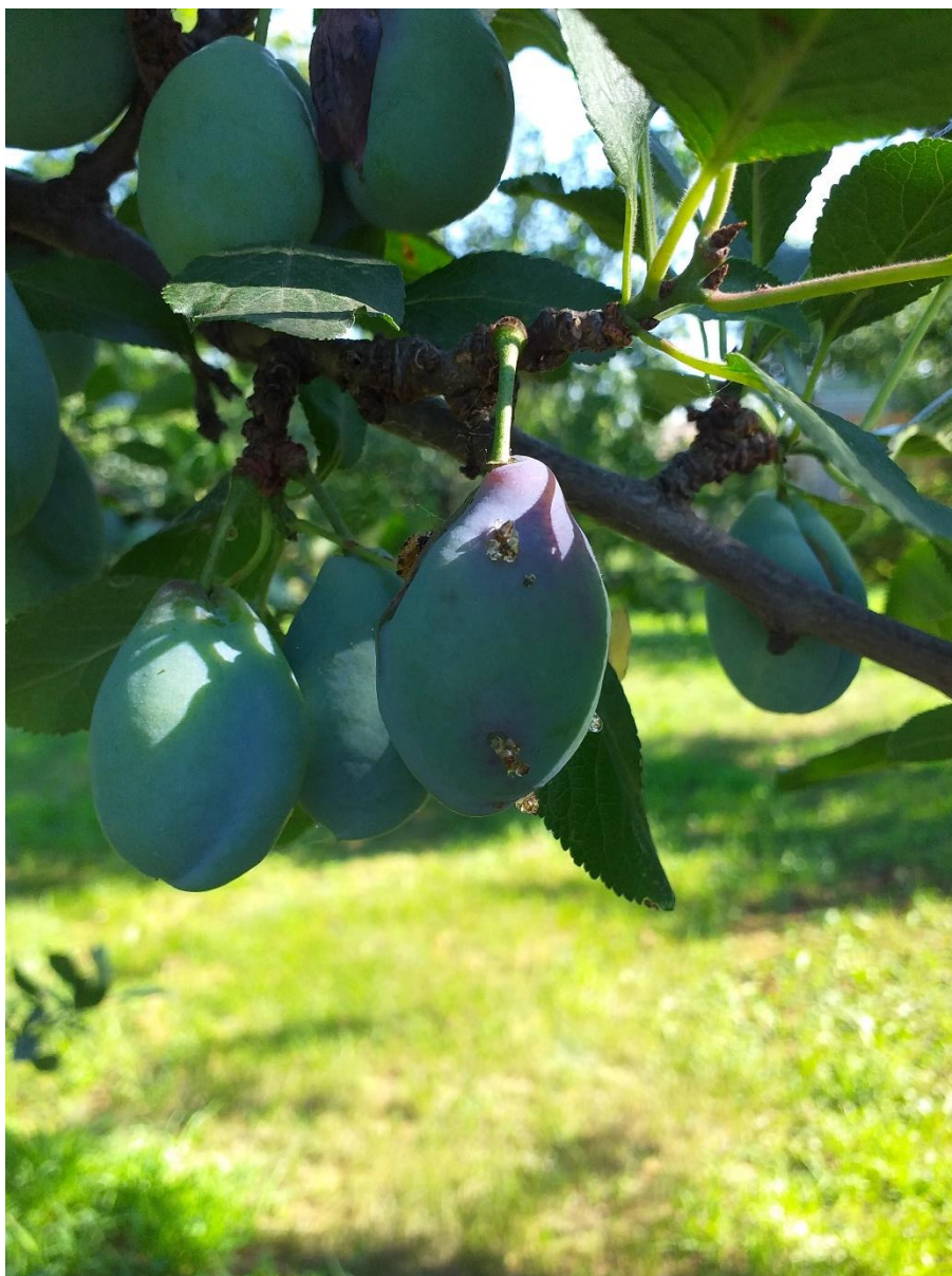
SLIKA 2. CURENJE SMOLE IZ NAPADNUTOG PLODA ŠLJIVE

VIZUELNIM PREGLEDIMA ZASADA ŠLJIVA REGISTROVANA SU JAJA OVE ŠTETOČINE U RAZLIČITIM FAZAMA RAZVOJA KAO I ISPILJENE LARVE. U TOKU JE PERIOD INTENZIVNOG PILJENJA LARVI DRUGE GENERACIJE ŠLJIVINOG SMOTAVCA.