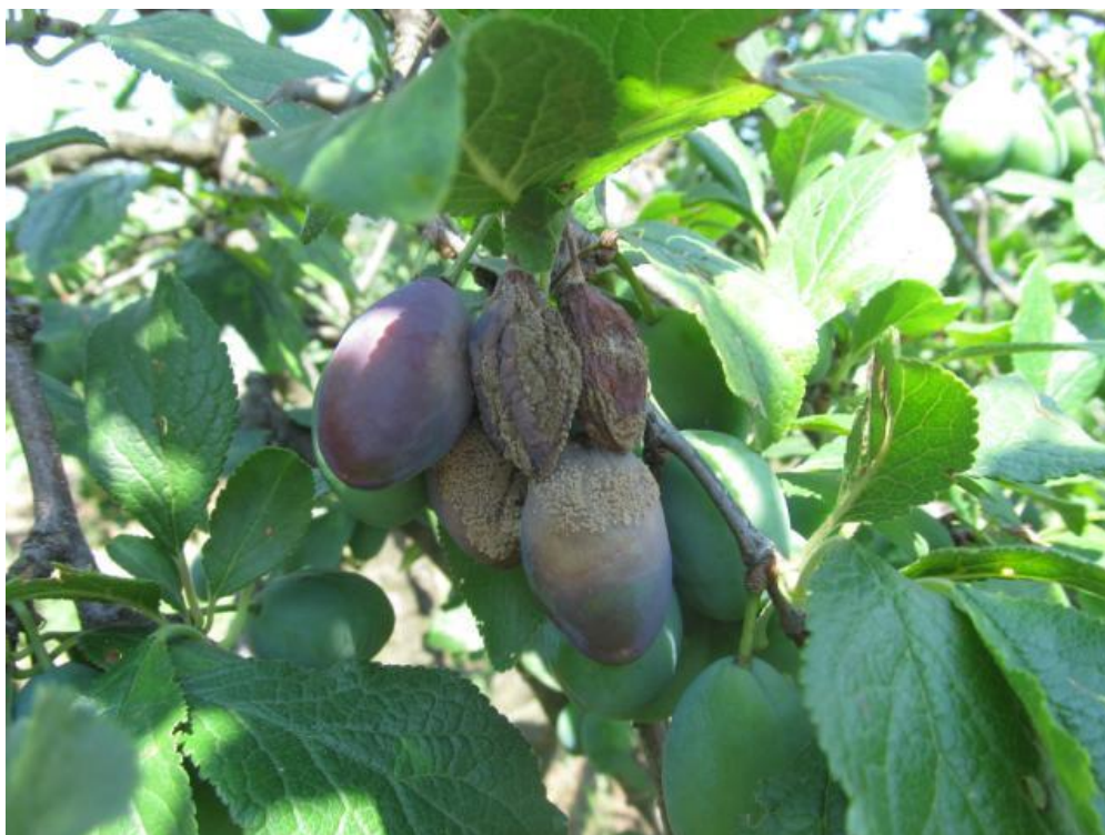
SLIKA 4. SIMPTOMI TRULEŽI NA PLODOVIMA ŠLJIVE

PLODOVI ZARAŽENI SA GLJIVAMA IZ RODA MONILINIA MOGU BITI I OGRANIČAVAJUĆI FAKTOR PRILIKOM IZVOZA NAŠEG VOĆA NA STRANA TRŽIŠTA. JEDNA OD GLJIVA IZ GRUPE PROUZROKOVAČA TRULEŽI IMA KARANTINSKI STATUS U NEKIM ZEMLJAMA GDE SE IZVOZI NAŠE VOĆE, TE SE POSEBAN OPREZ PREPORUČUJE PROIZVOĐAČIMA KOJI SU ORIJENTISANI KA IZVOZU.