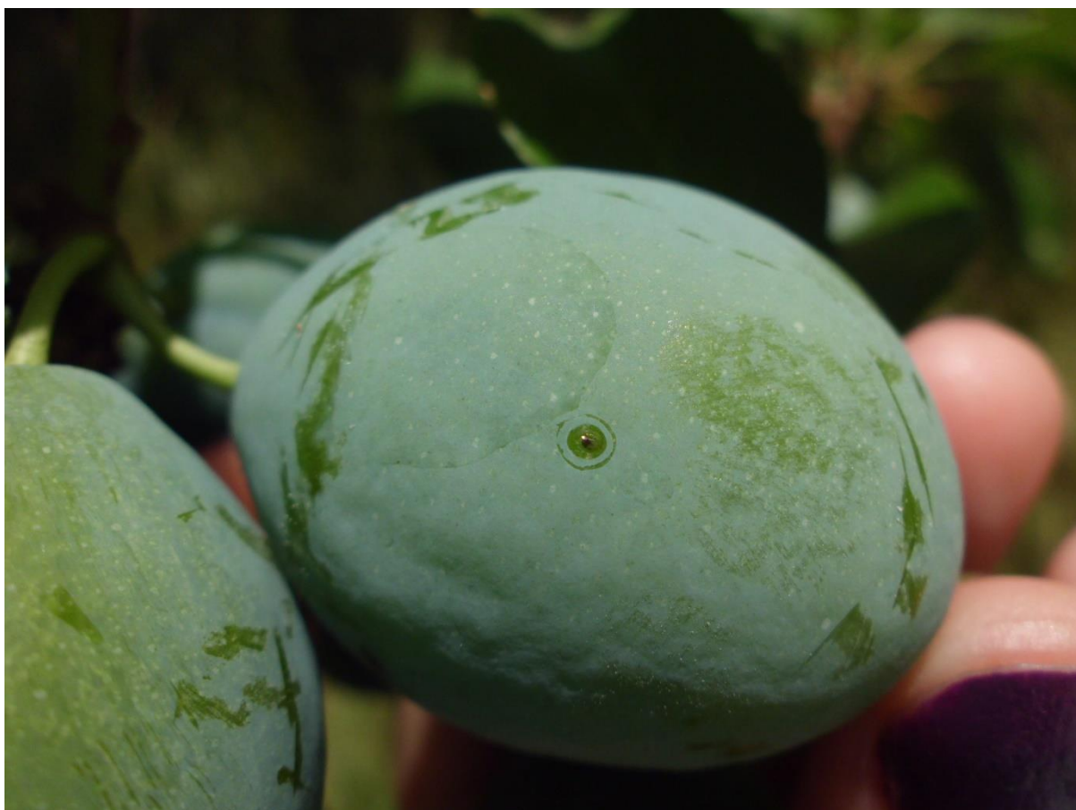
SLIKA 3. JAJE ŠLJIVINOG SMOTAVCA NA PLODU