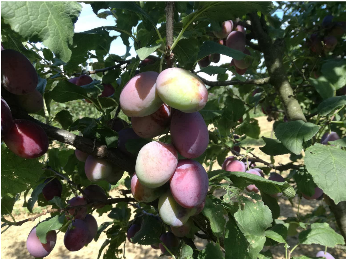
SLIKA 1. FAZA RAZVOJA ŠLJIVE

NA PODRUČJU VOJVODINE U TOKU JE BERBA RANHI SORTI ŠLJIVA, DOK SE SREDNJE I KASNE SORTE NALAZE U FAZI OD PLODOVI DOSTIGLI 70% KRAJNJE VELIČINE DO POČETKA OBOJAVANJA PLODA.