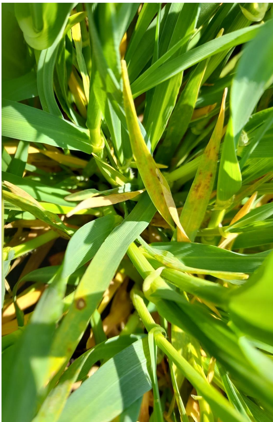
SLIKA 6. SIMPTOMI MREŽASTE PEGAVOSTI LISTA JEČMA I SOČIVASTE PEGAVOSTI

..... POŠTOVANI POLJOPRIVREDNI PROIZVOĐAČI I POŠTOVANI GLEDAOCI, DETALJNIJE INFORMACIJE O POJAVI ŠTETNIH ORGANIZAMA I MERAMA KONTROLE MOŽETE POGLEDATI NA SAJTU PROGNOZNO IZVEŠTAJNE SLUŽBE ZAŠTITE BILJA VOJVODINE WWW.PISVOJVODINA.COM