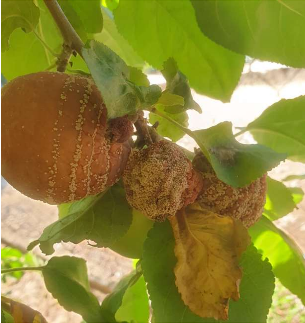
SLIKA 5. SIMPTOM SMEĐE ILI MRKE TRULEŽI PLODOVA