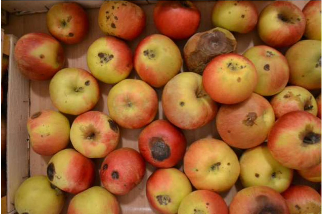
SLIKA 6. SIMPTOMI SKLADIŠNIH BOLESTI JABUKE