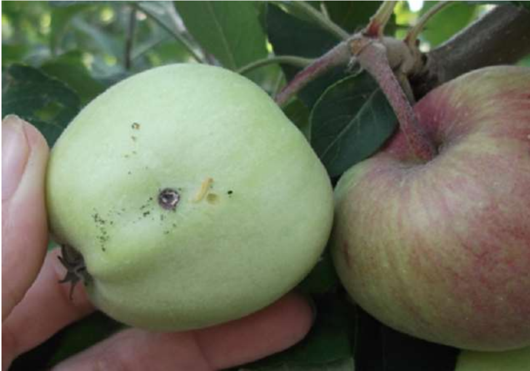
SLIKA 3. LARVA JABUKINOG SMOTAVCA I OŠTEĆENJE NA PLODU