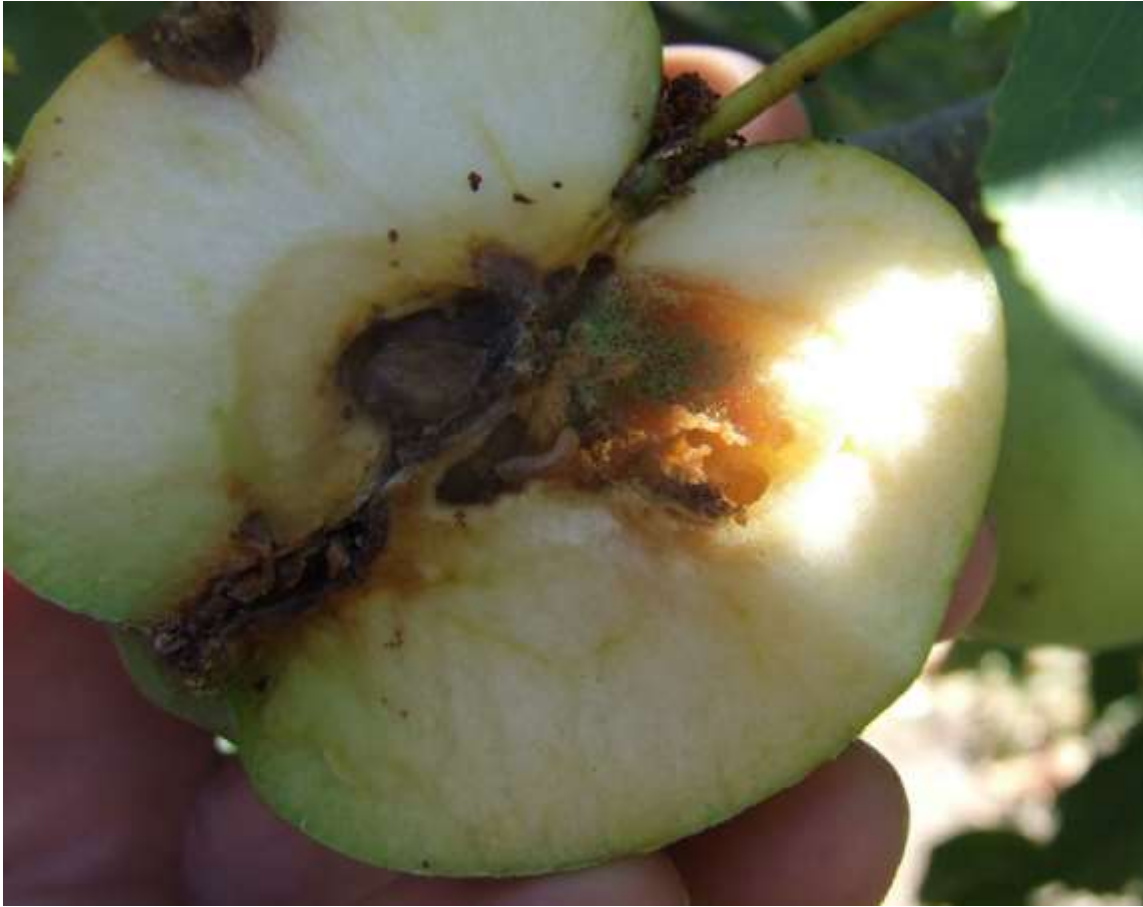
SLIKA 4. LARVA JABUKONOG SMOTAC U PLODU JABUKE