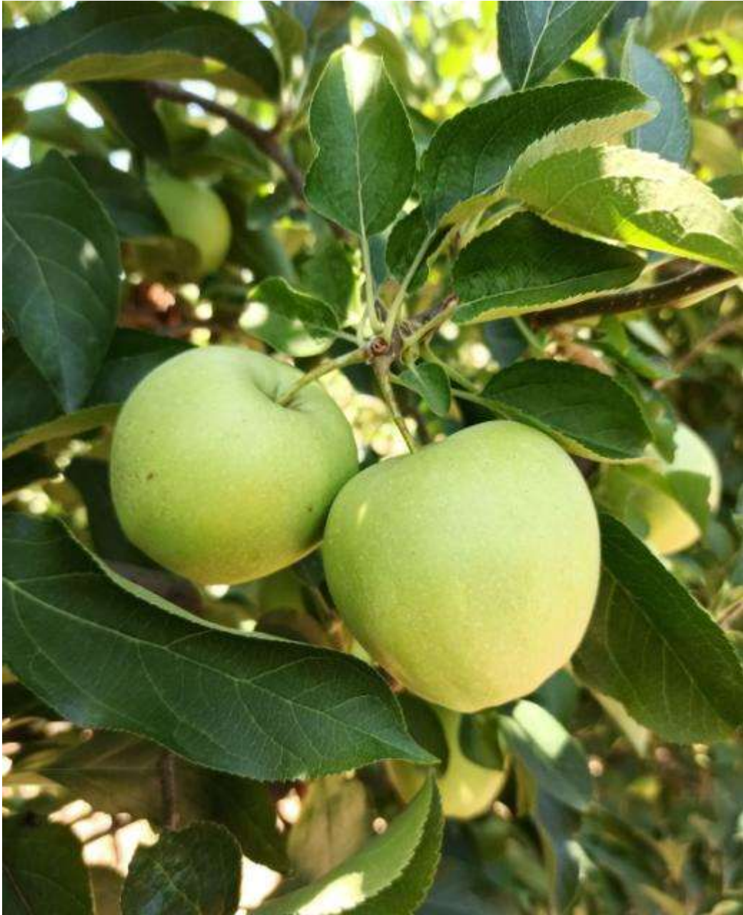
SLIKA 1. FAZA RAZVOJA JABUKE