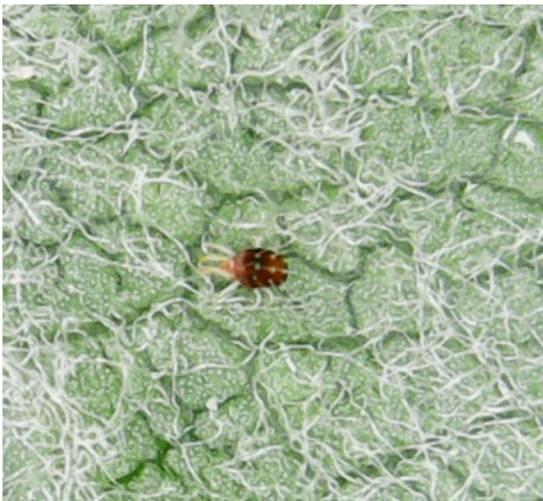
SLIKA 6. CRVENA VOĆNA GRINJA NA NALIČJU LISTA