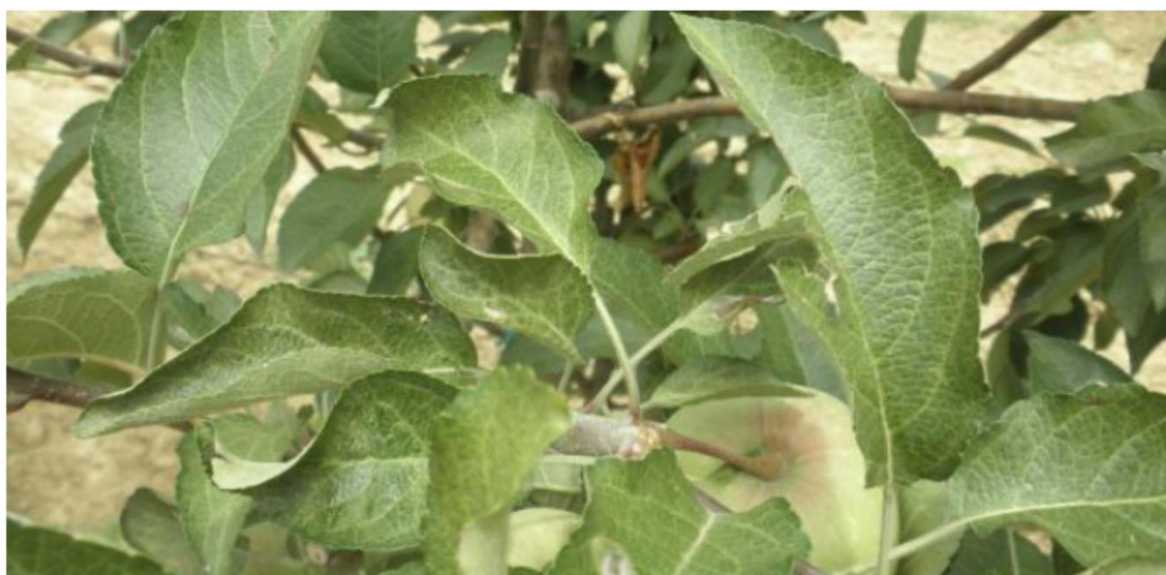
SLIKA 7. SIMPTOM NAPADA CRVENE VOĆNE GRINJE NA JABUCI