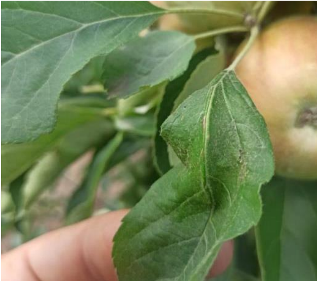
SLIKA 5. SIMPTOM NAPADA OBIČNOG PAUČINARA NA JABUCI