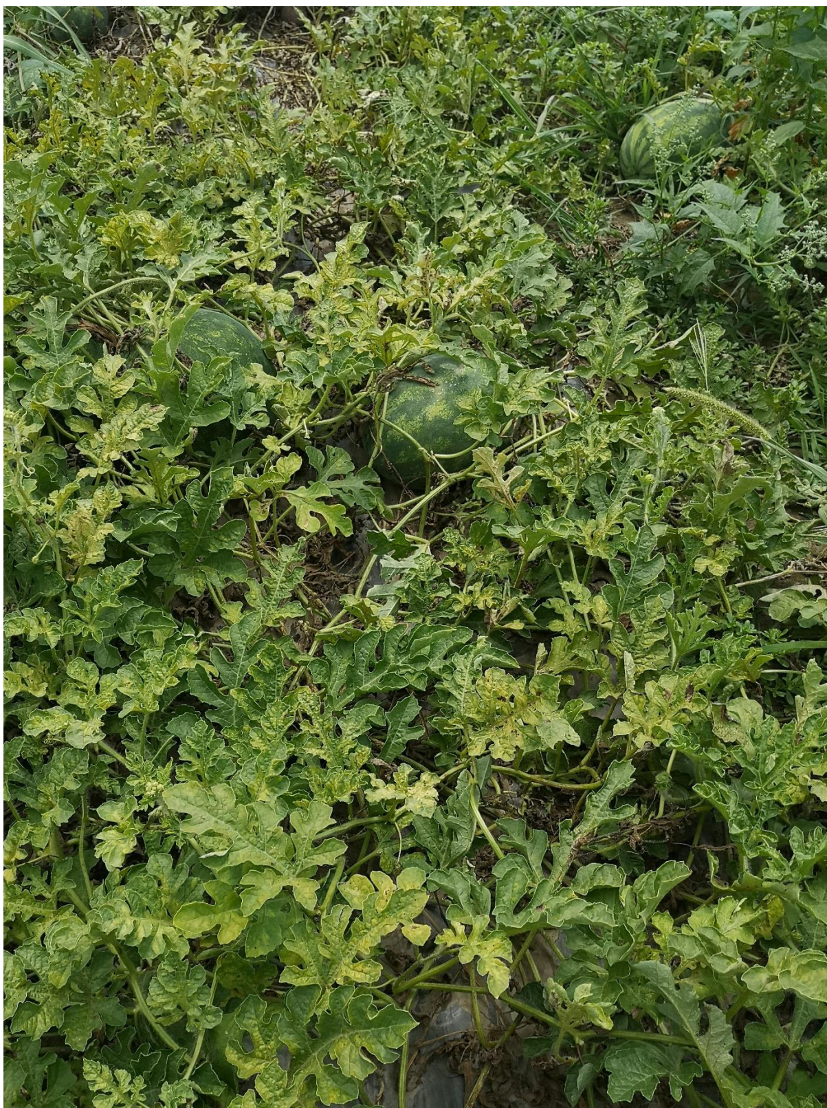
SLIKA 4. SIMPTOM NAPADA OBIČNOG PAUČINARA NA LUBENICI