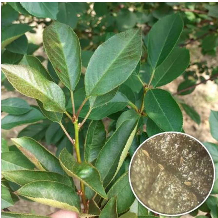
SLIKA 8. SIMPTOM NAPADA RĐASTE GRINJE NA VIŠNJI

RĐASTE GRINJE PRIPADAJU GRUPI ERIOFIDNIH GRINJA. ŠTETNI SU SVI POKRETNI STADIJUMI GRINJA KOJI SE HRANE NA LIŠĆU SISANJEM SOKOVA. NAPADNUTO LIŠĆE DOBIJA BRONZASTU BOJU I UVIJA SE PREMA LICU. JAKO NAPADNUTO LIŠĆE SE SUŠI I PREVREMENO OPADA. KOD NAPADNUTOG LIŠĆA OMETENA JE FOTOSINTEZA I POJAČANA JE TRANSPIRACIJA ŠTO DOVODI DO IZNURIVANJA VOĆAKA, SMANJENJA PRINOSA I KVALITETA PLODOVA, A ŠTETNOST SE MOŽE ODRAZITI I U NAREDNOJ GODINI.