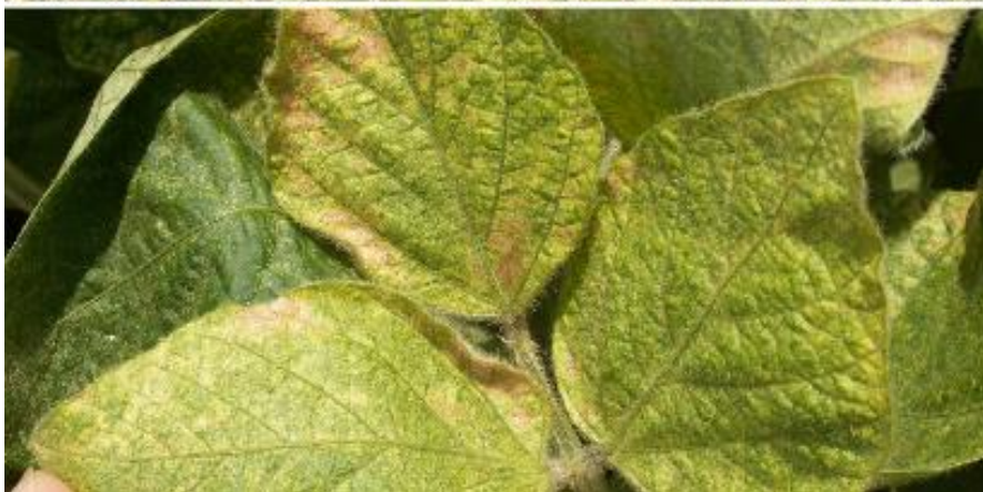
SLIKA 3. SIMPTOM NAPADA OBIČNOG PAUČINARA NA SOJI