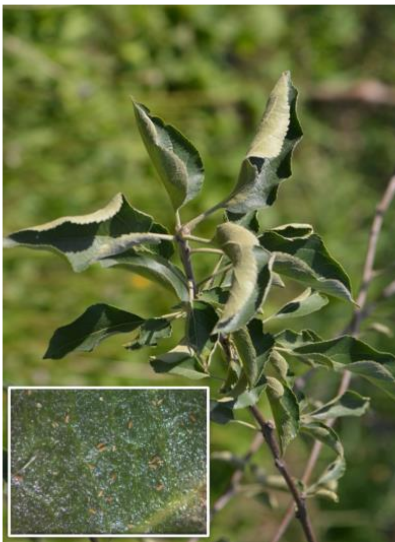
SLIKA 9. SIMPTOM NAPADA RĐASTE GRINJE NA JABUCI