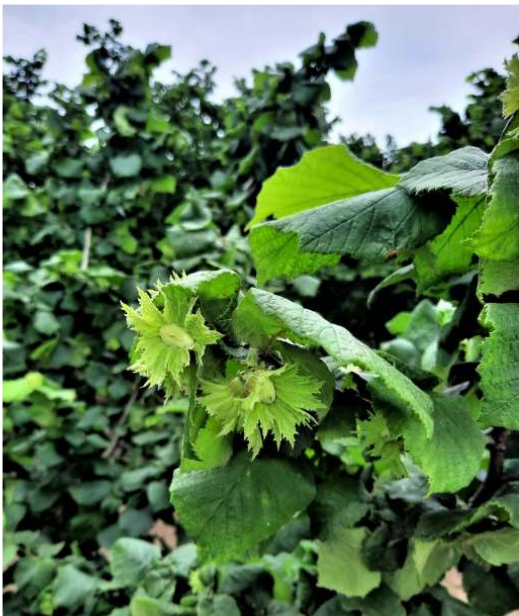
SLIKA 1. FAZA RAZVOJA LESKE