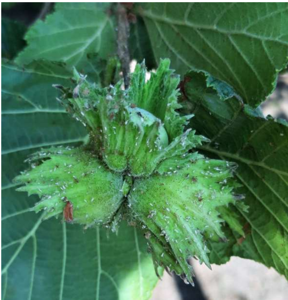
SLIKA 3. LESKINA LISNA VAŠ NA PLODU