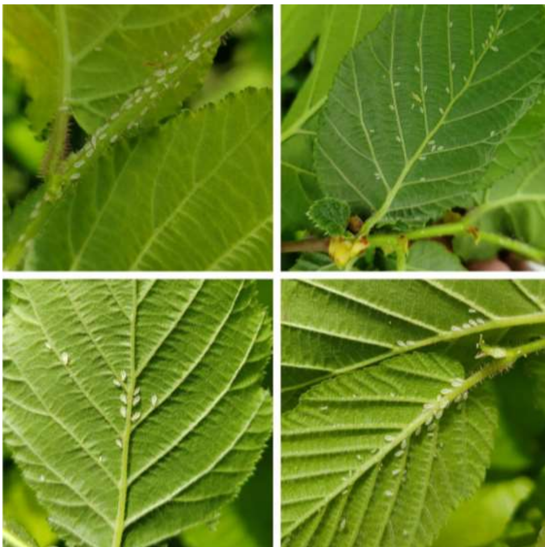
SLIKA 2. LESKINA LISNA VAŠ NA NALIČJU LISTOVA I GRANČICAMA