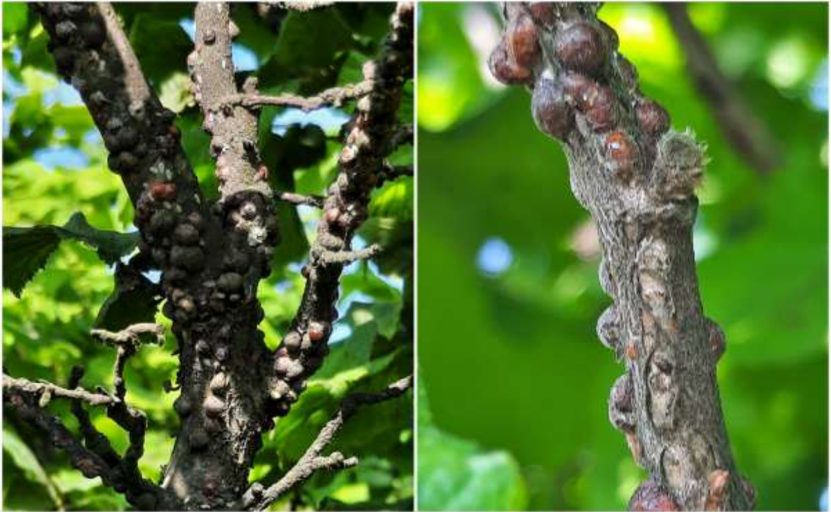
SLIKA 4. LESKINA ŠTITASTA VAŠ