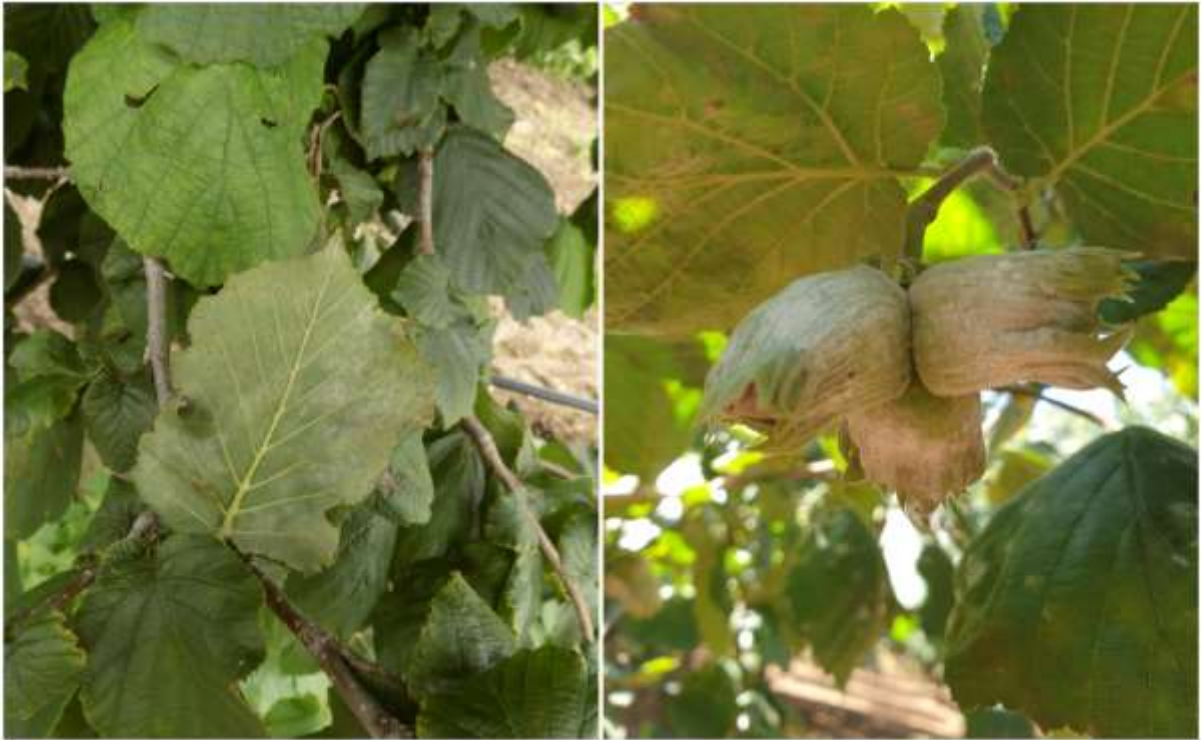
SLIKA 6. SIMPTOMI PEPELNICE LESKE NA LISTU I PLODU